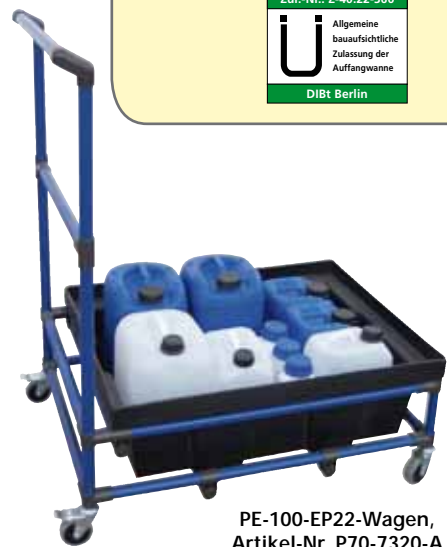
PE-100-EP22-Wagen, Artikel-Nr. P70-7320-A