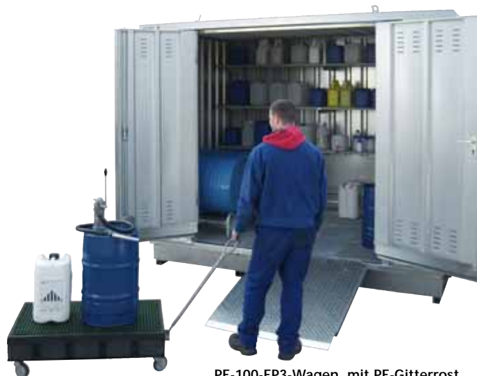
PE-100-EP3-Wagen, mit PE-Gitterrost, Artikel-Nr. P70-7311-A