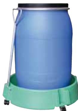
FR-PE-200, Artikel-Nr. P70-7150-A