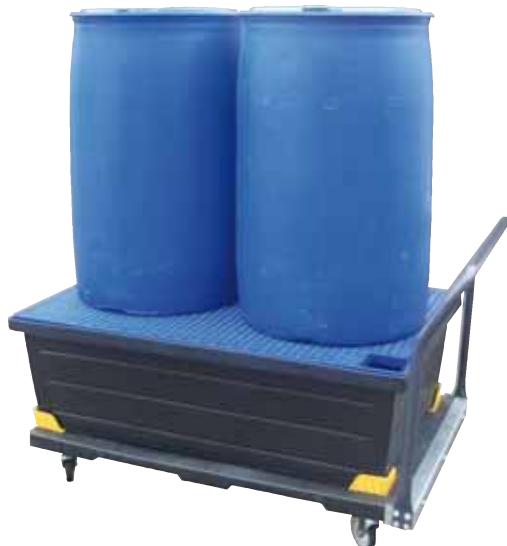
PE-200-EP9-Wagen, mit PE-Gitterrost, Artikel-Nr. P70-7314-A