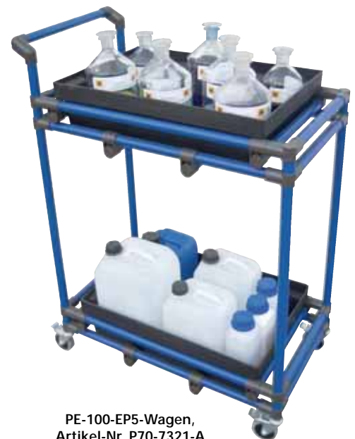
PE-100-EP5-Wagen, Artikel-Nr. P70-7321-A