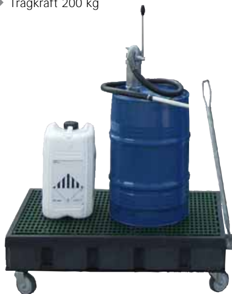
PE-100-EP3-Wagen, mit PE-Gitterrost, Artikel-Nr. P70-7311-A

Zum Lagern und Transportieren von wassergefährdenden und aggressiven Medien in 200-Liter-Fässern