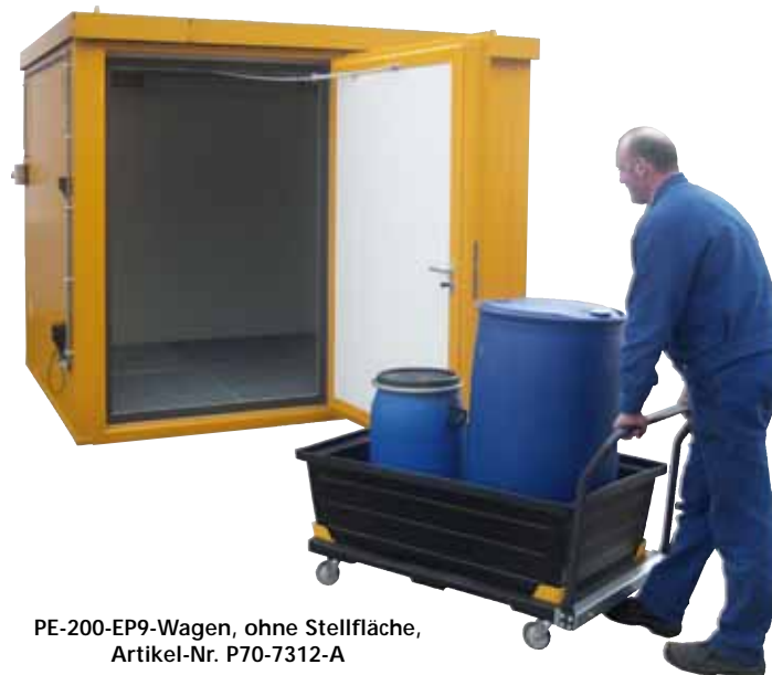
PE-200-EP9-Wagen, ohne Stellfläche, Artikel-Nr. P70-7312-A

* maximale Kapazität bei Verwendung mit PE-Gitterrost