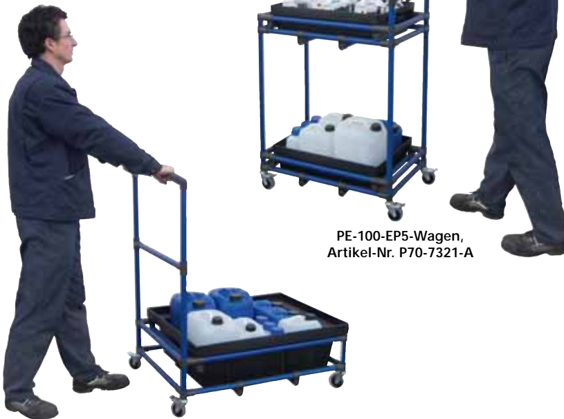
PE-100-EP5-Wagen, Artikel-Nr. P70-7321-A