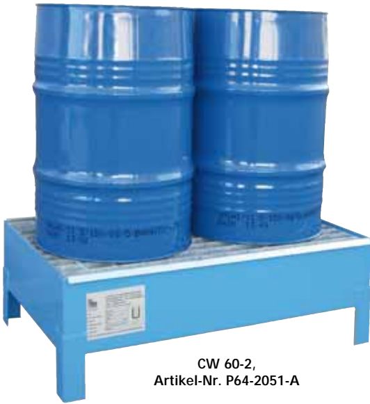
CW 60-2, Artikel-Nr. P64-2051-A