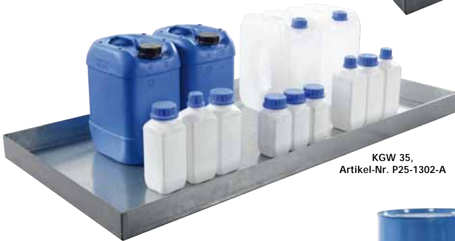
KGW 35, Artikel-Nr. P25-1302-A