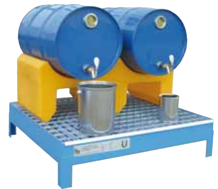
CW 60-4, Artikel-Nr. P64-2052-A, mit optionalem Fassbock aus PE