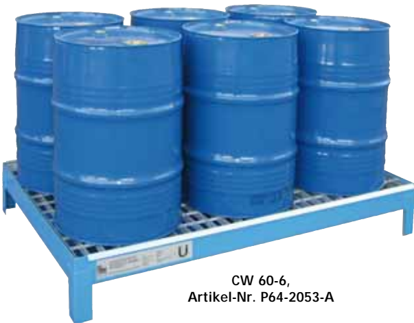
CW 60-6, Artikel-Nr. P64-2053-A

Fassböcke aus PE finden Sie auf Seite 46!