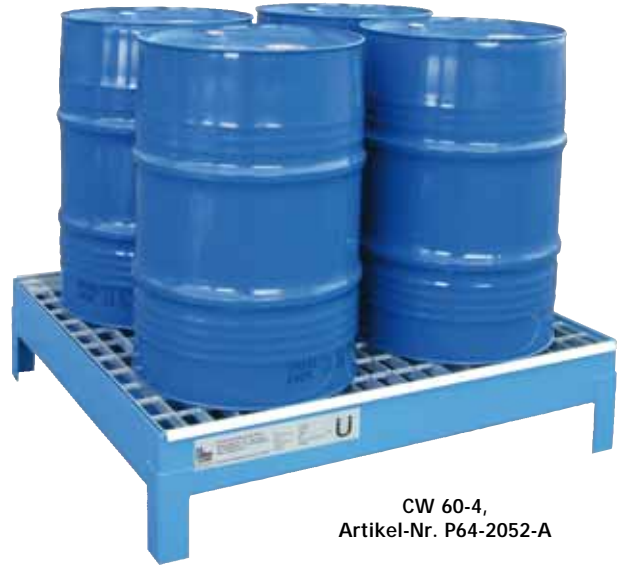
CW 60-4, Artikel-Nr. P64-2052-A