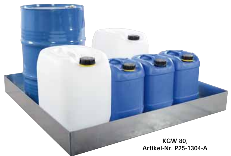
KGW 80, Artikel-Nr. P25-1304-A