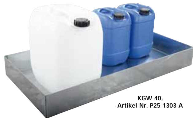
KGW 40, Artikel-Nr. P25-1303-A

PE-Wannen zur Kleingebindelagerung finden Sie auf Seite 35!