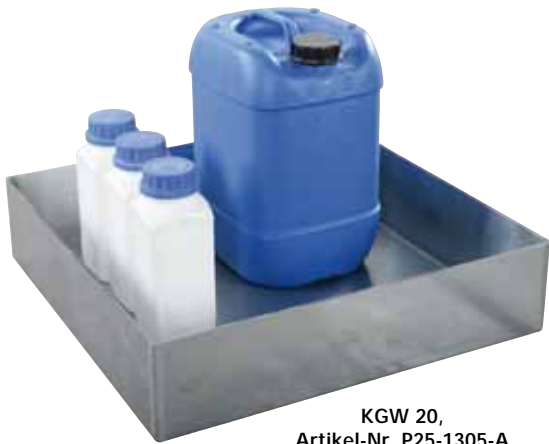
KGW 20, Artikel-Nr. P25-1305-A