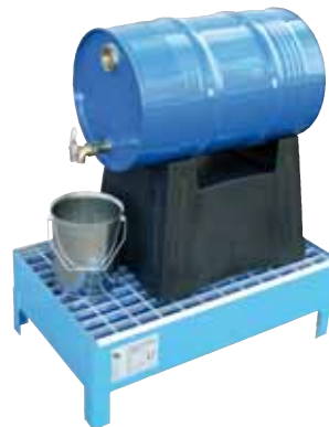
CW 60-2, Artikel-Nr. P64-2051-A, mit optionalem Fassbock aus PE