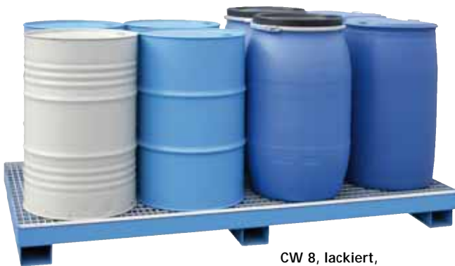
CW 8, lackiert, Artikel-Nr. P65-2005-A