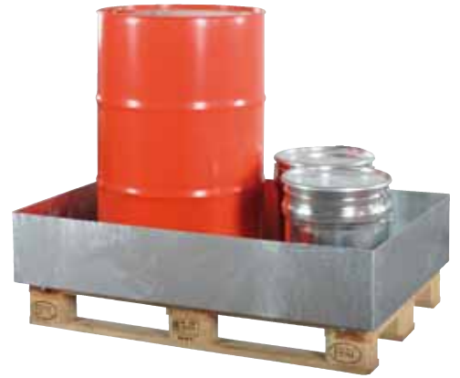
EW 2, feuerverzinkt, ohne Gitterroste, Artikel-Nr. P66-1301-A