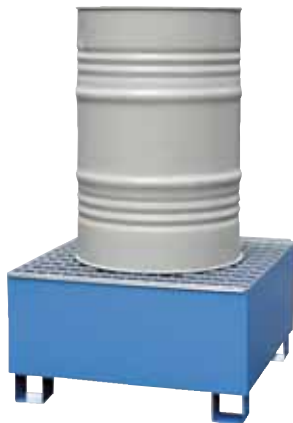
CW 1, lackiert, Artikel-Nr. P65-2001-A