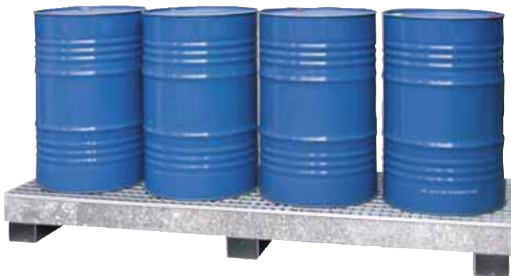
CW 4L, feuerverzinkt, Artikel-Nr. P65-1004-A

Wannen in Edelstahl finden Sie auf Seite 32!