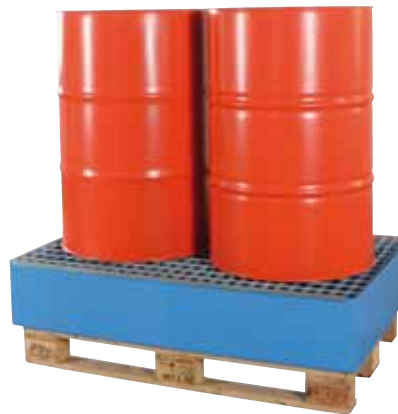
EW 2, lackiert, inkl. Gitterroste, Artikel-Nr. P66-2303-A

* maximale Kapazität bei Verwendung mit verzinktem Gitterrost