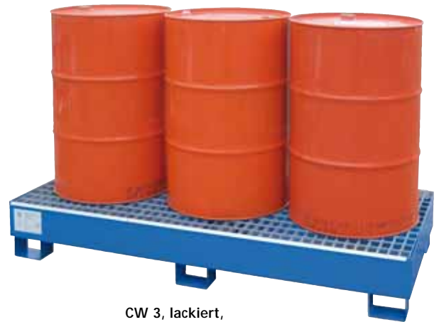
CW 3, lackiert, Artikel-Nr. P65-2007-A