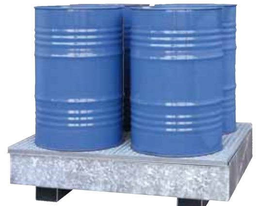
CW 4, feuerverzinkt, Artikel-Nr. P65-1003-A