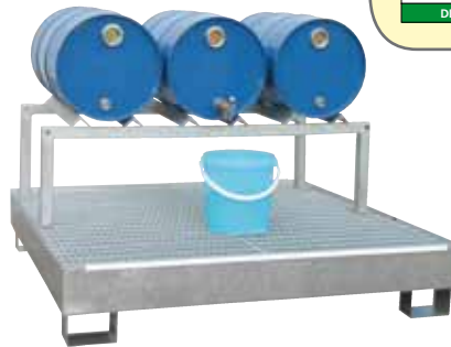
CW 4, feuerverzinkt, Artikel-Nr. P65-1003-A, mit optionalem Fassbock