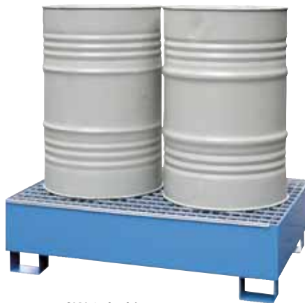
CW 2, lackiert, Artikel-Nr. P65-2002-A