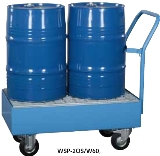
WSP-20S/W60, Artikel-Nr. P21-1408-A