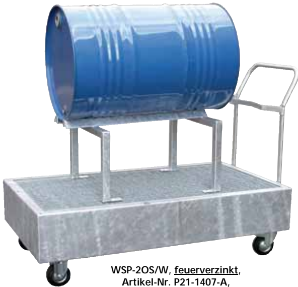
WSP-20S/W, feuerverzinkt , Artikel-Nr. P21-1407-A, mit optionalem Fassbock