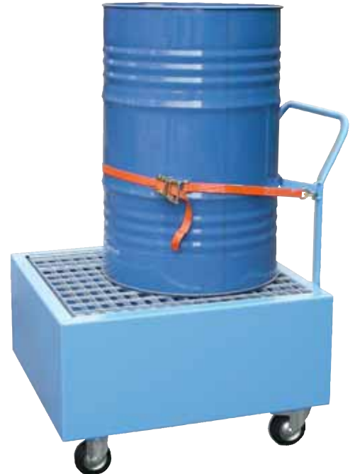
WSP-10S/W, Artikel-Nr. P21-2406-A, mit optionalem Zurrgerät

Passende Fassböcke finden Sie auf Seite 17!