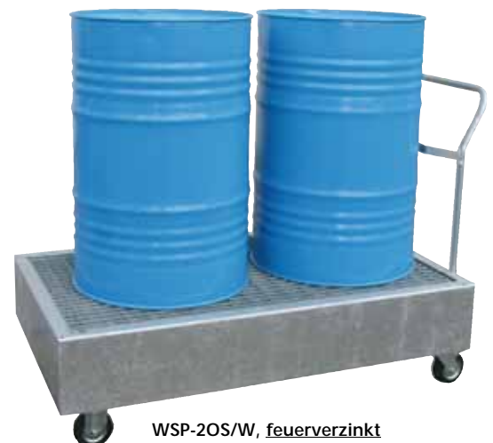
WSP-20S/W, feuerverzinkt Artikel-Nr. P21-1407-A

Fahrbare PE-Auffangwannen finden Sie auf Seite 47/48!