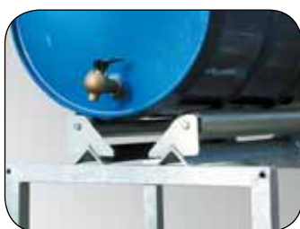
Drehbare Rollenauflage, Artikel-Nr. Z50-1925-B