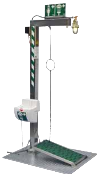
Ausführungsbeispiel mit Beheizung

Notduschen müssen 24 Stunden am Tag, 7 Tage die Woche funktionsbereit sein. Dies gilt auch bei Aufstellung in Außenbereichen bei Temperaturen unter dem Gefrierpunkt. Hier kommt bei unseren Duschen ein selbstregelndes Begleitheizkabel in Verbindung mit einem Isolierpaket zur Gewährleistung der Frostfreiheit zum Einsatz. Ein integriertes Thermostat regelt das System. Alle wasserführenden Teile sind zusätzlich mit einem Isolierpaket mit Edelstahlabdeckung gegen starken Frost gesichert. Sie können zwischen verschiedenen Ausführungen und Zubehörteilen wählen.