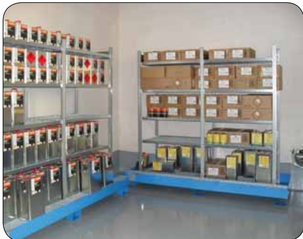
Brandschutzdepot F90 ausgerüstet mit Gefahrstoffregal und Standwanne GR2-G