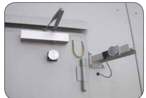
Türfeststelleinrichtung mittels Türhalte magnet