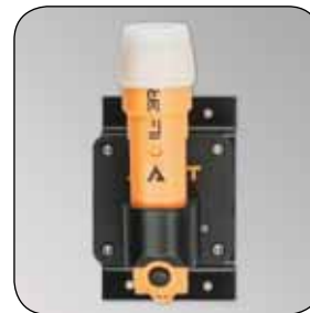
Ladegerät ADALIT® IL-3R ATEX, Artikel-Nr. B69-7412-A