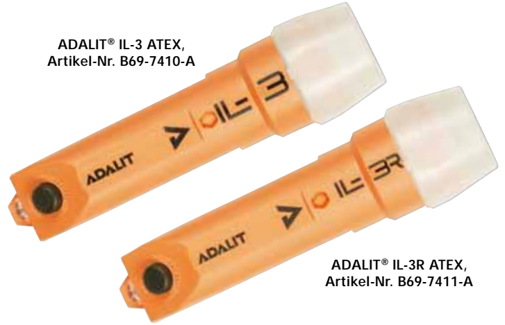
ADALIT® IL-3R ATEX, Artikel-Nr. B69-7411-A