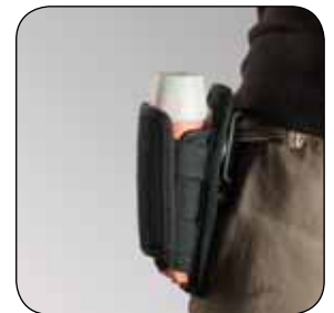
Holster um 360° drehbar ADALIT® IL-3 / IL-3R ATEX, Artikel-Nr. B69-7271-A