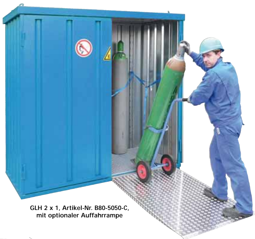
GLH 2 x 1, Artikel-Nr. B80-5050-C, mit optionaler Auffahrrampe