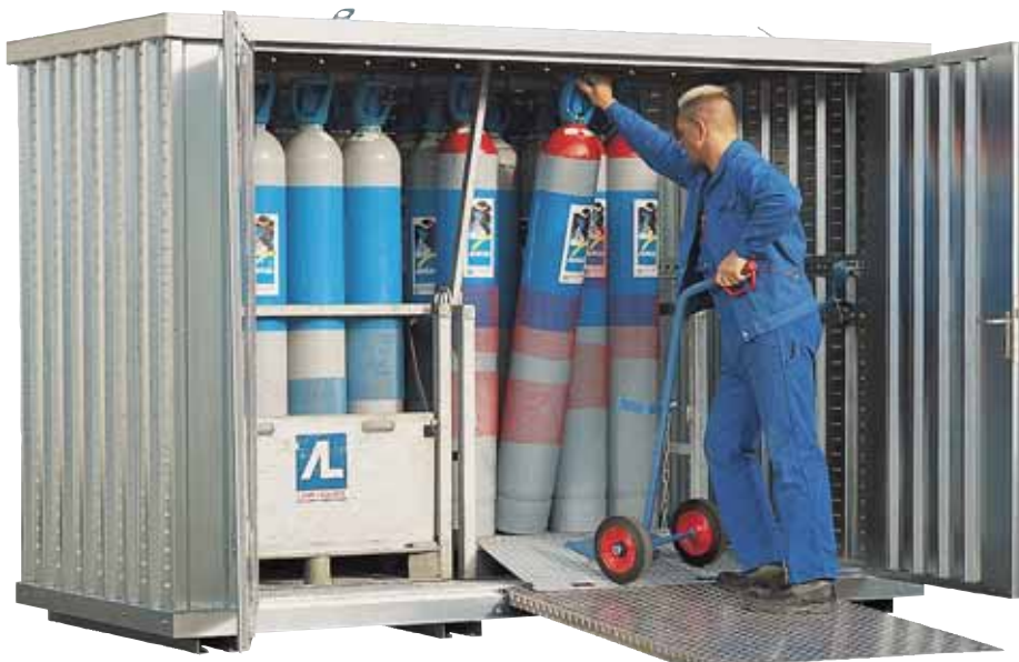
GLH 3 x 2, Tür in Sonderausführung, mit optionaler Auffahrrampe