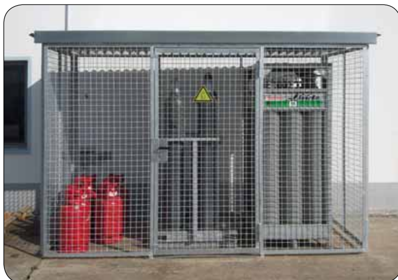
LB-3115, Artikel-Nr. C27-1120-C