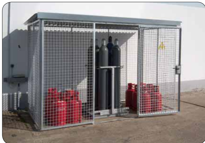
LB-3115, Artikel-Nr. C27-1120-C