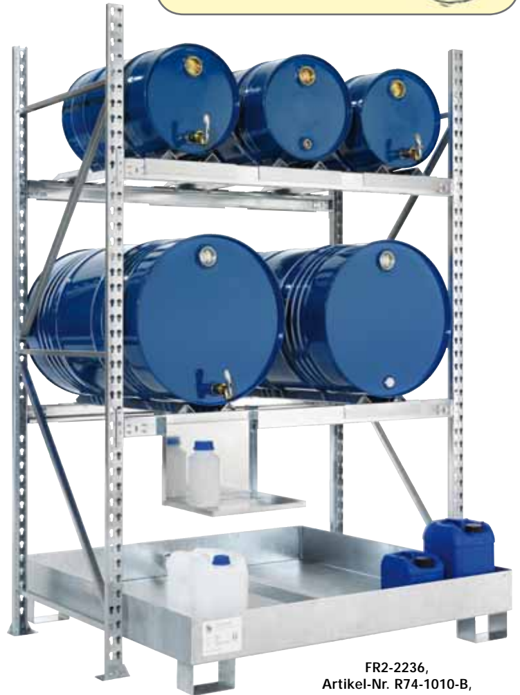
FR2-2236, Artikel-Nr. R74-1010-B, mit optionalem Kannenträger