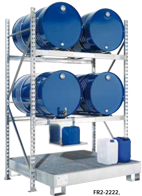
FR2-2222, Artikel-Nr. R74-1007-B, mit optionalem Kannenträger