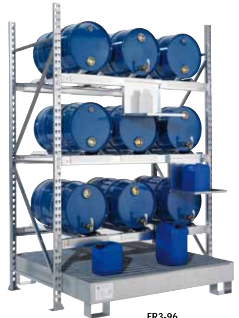
FR3-96, Artikel-Nr. R74-1023-B, mit optionalem Kannenträgern