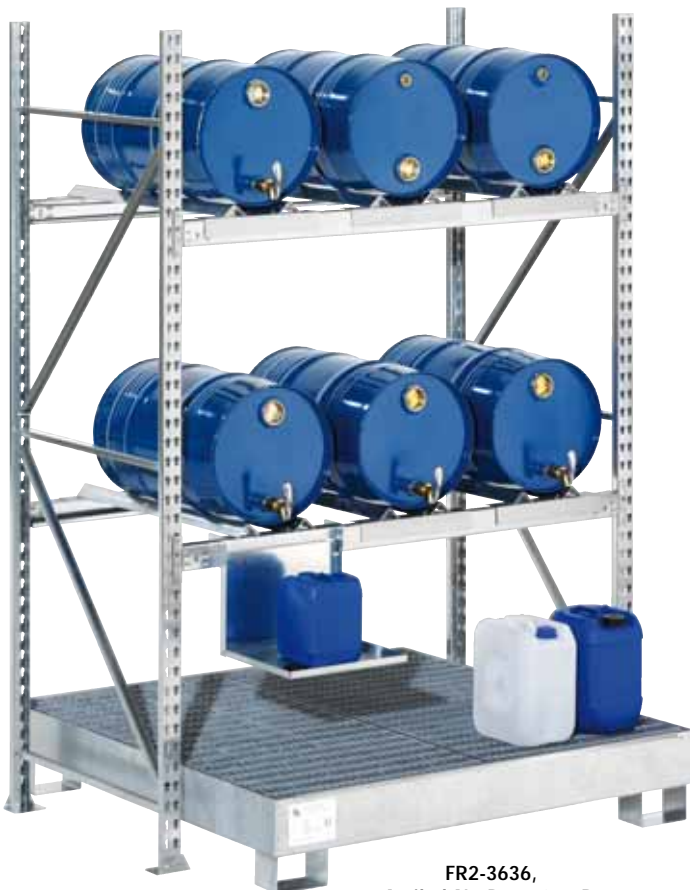
FR2-3636, Artikel-Nr. R74-1015-B, mit optionalem Kannenträger