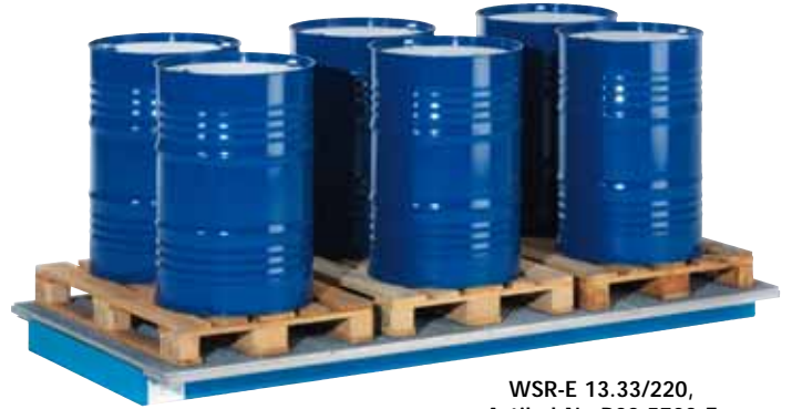
WSR-E 13.33/220, Artikel-Nr. R23-5703-E