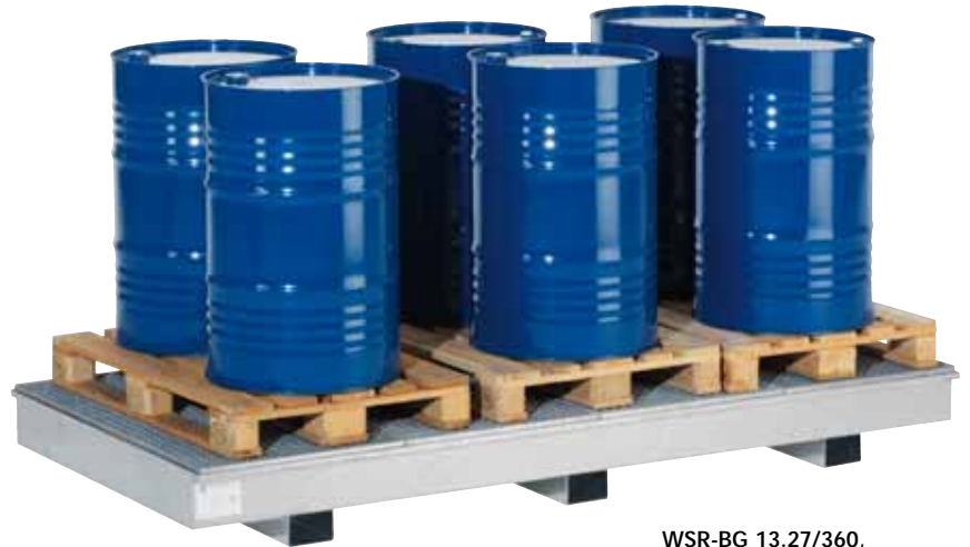
WSR-BG 13.27/360, Artikel-Nr. R23-1902-F