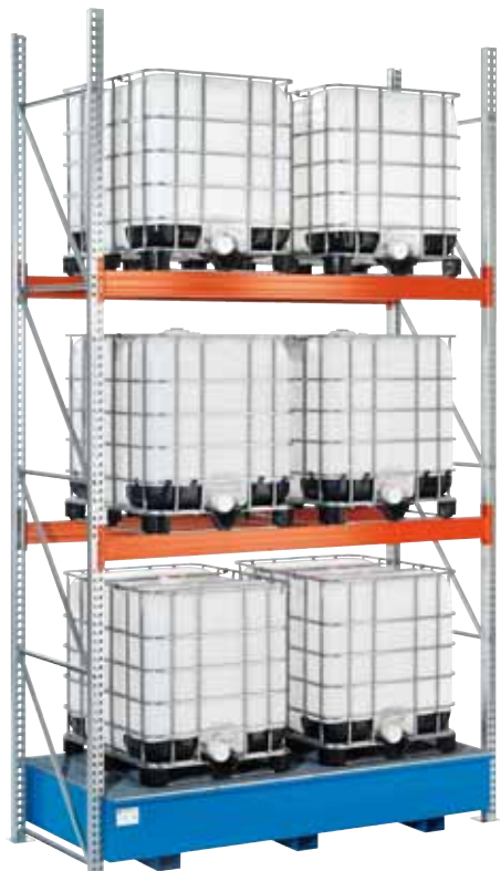
WSR-BG 13.22/1000, Artikel-Nr. R23-5904-F, in ein KTC-Regal integriert