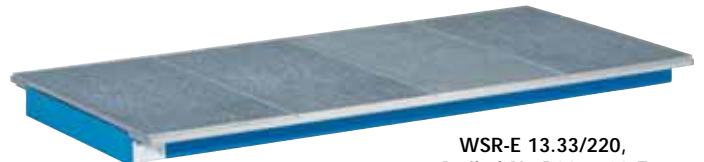
WSR-E 13.33/220, Artikel-Nr. R23-5703-E