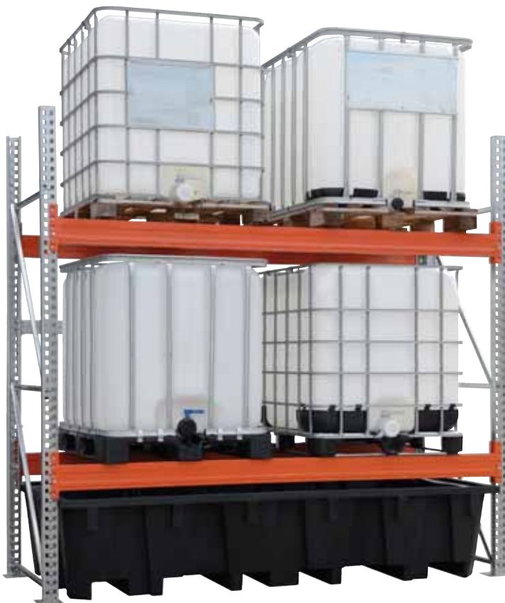
PE-RW 2, Artikel-Nr. P70-7141-A, in ein KTC-Regal integriert