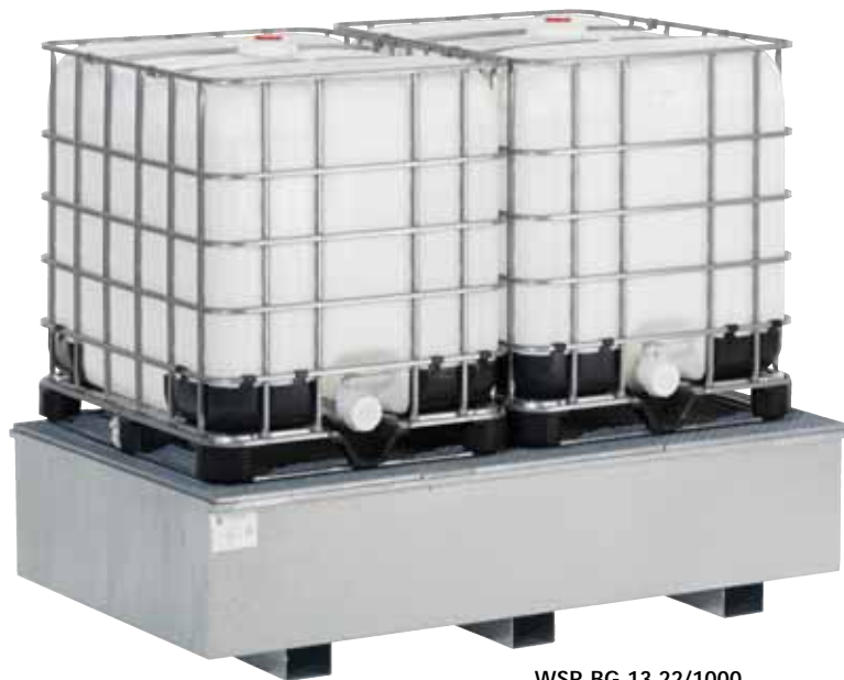
WSR-BG 13.22/1000, Artikel-Nr. R23-1904-F

Bei Ausstattung mit Gitterrost kann die Regalbodenwanne auch als 1. Lagerebene genutzt werden.