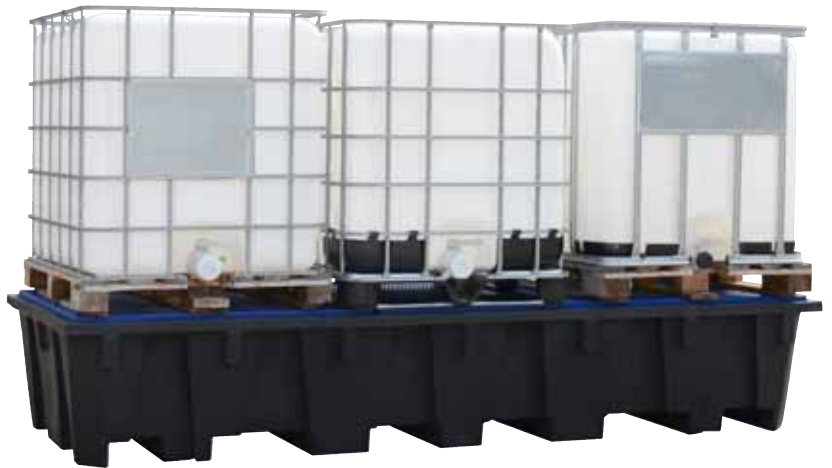
PE-RW 3, mit PE-Gitterrost, Artikel-Nr. P70-7143-A