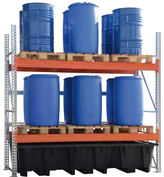
PE-RW 2, Artikel-Nr. P70-7141-A, in ein Palettenregal integriert

Unser komplettes Sortiment an Auffangwannen aus PE finden Sie ab Seite 33!