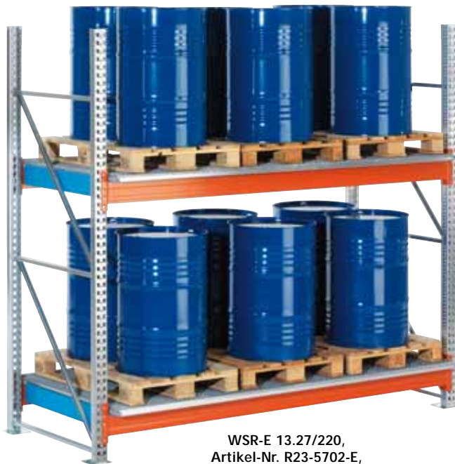
WSR-E 13.27/220, Artikel-Nr. R23-5702-E, eingebaut in ein Palettenregal