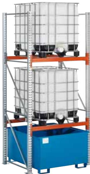
G-KR 2.14/1000, Grundfeld

Durch die zusätzliche Ausstattung mit Gitterrosten können unterschiedlichste KTC's und Großgebände gelagert werden!