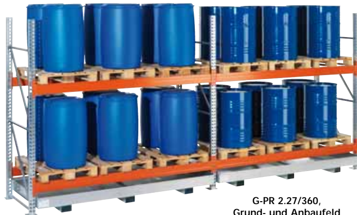
G-PR 2.27/360, Grund- und Anbaufeld