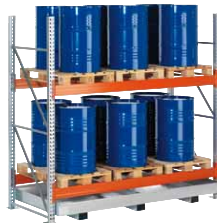
G-PR 2.27/360, Grundfeld