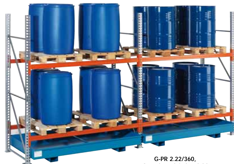
G-PR 2.22/360, Grund- und Anbaufeld