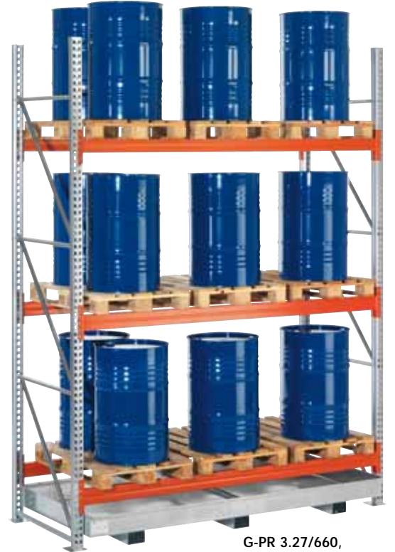
G-PR 3.27/660, Grundfeld

Gefahrstoff-KTC-Regale mit Auffangwannen finden Sie auf Seite 80!