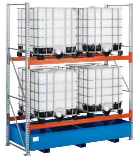
G-KR 2.27/1000, Grundfeld