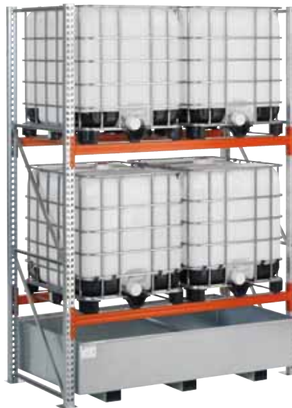
G-KR 2.22/1000, Grundfeld