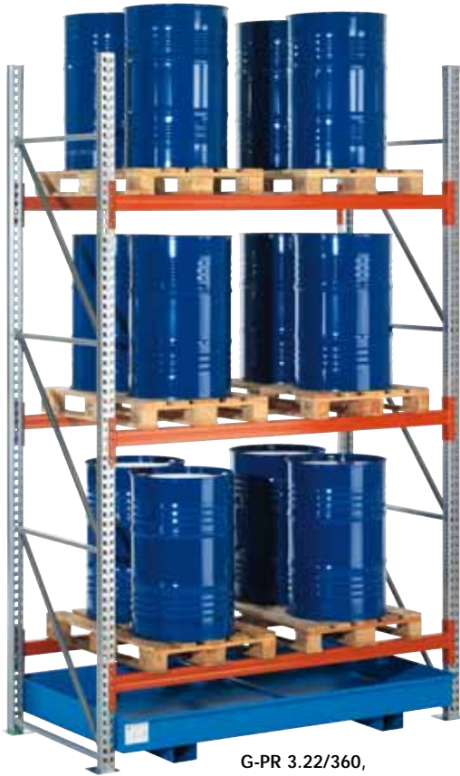
G-PR 3.22/360, Grundfeld