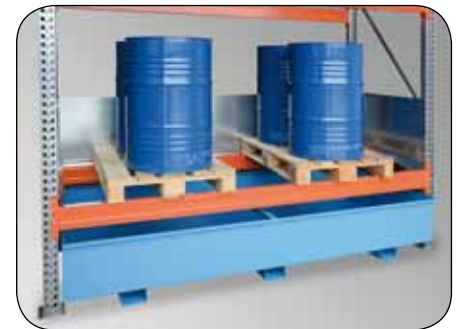
Umlaufendes Spritzschutzblech optional erhältlich