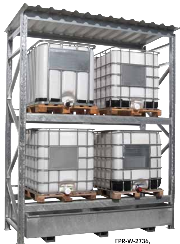
FPR-W-2736, Artikel-Nr. R26-3120-A