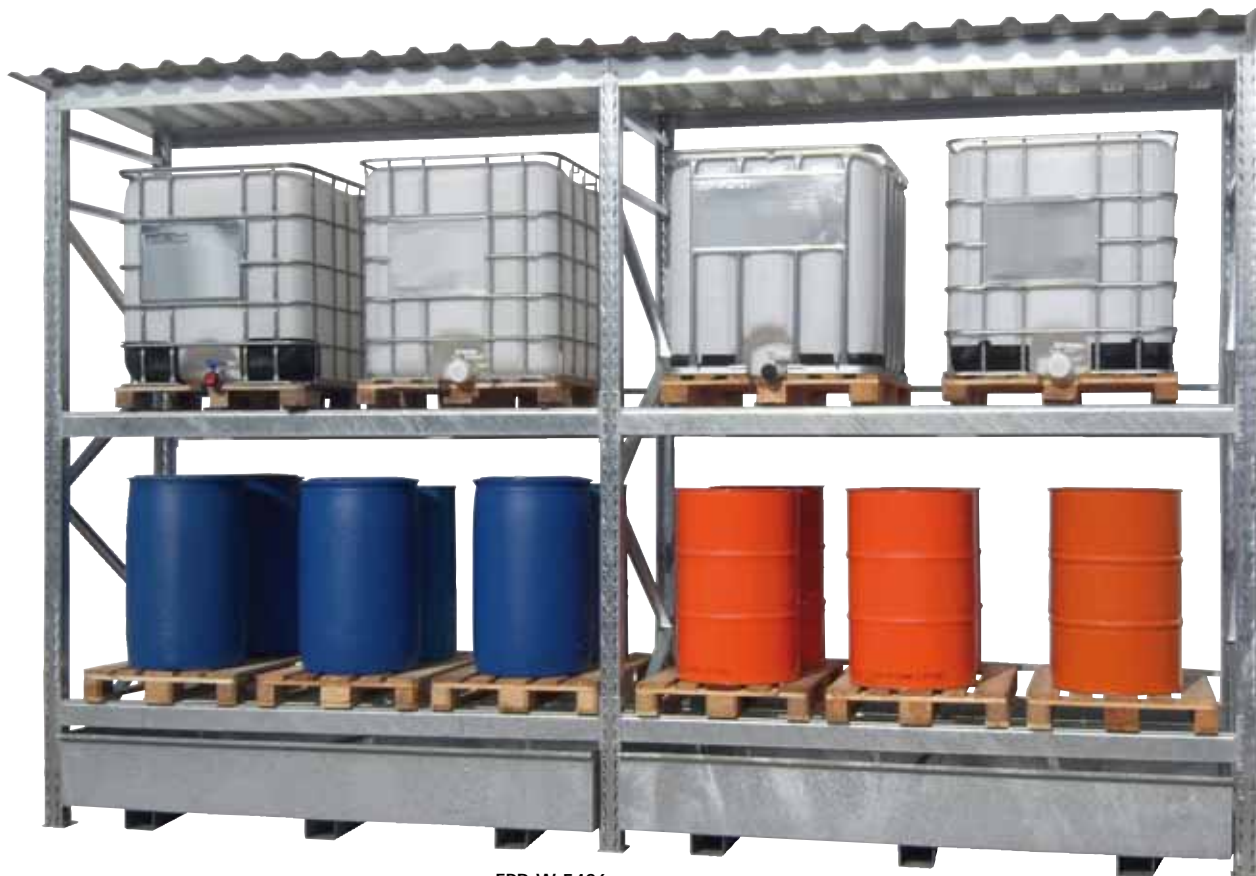
FPR-W-5436, Artikel-Nr. R26-3121-A