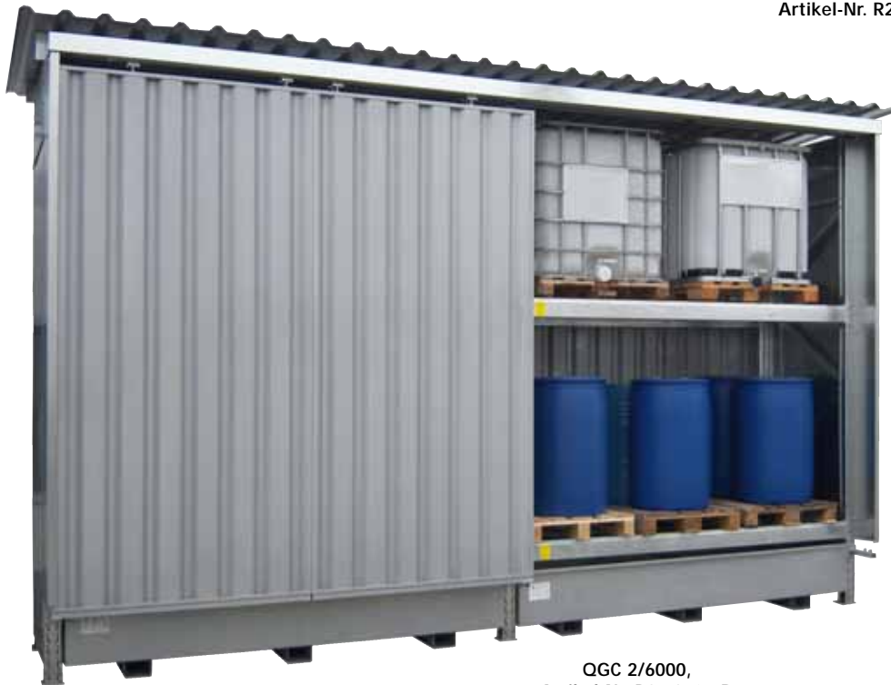
QGC 2/6000, Artikel-Nr. R26-2101-D