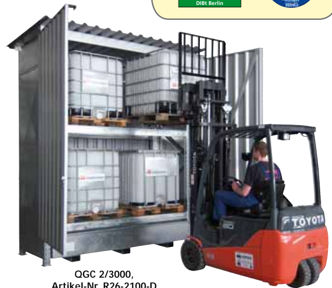
QGC 2/3000, Artikel-Nr. R26-2100-D