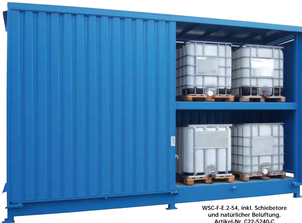
WSC-F-E.2-54, inkl. Schiebetore und natürlicher Belüftung, Artikel-Nr. C22-5240-C

KTC-Lagerschrank finden Sie auf Seite 172!