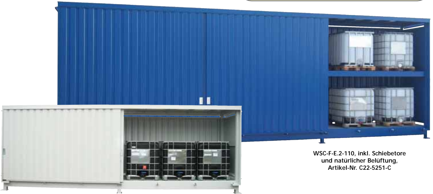
WSC-F-E.2-110, inkl. Schiebetore und natürlicher Belüftung, Artikel-Nr. C22-5251-C