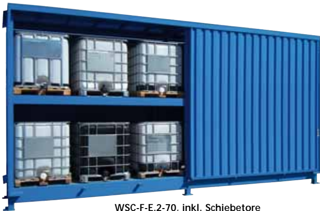
WSC-F-E.2-70, inkl. Schiebetore und natürlicher Belüftung, Artikel-Nr. C22-5234-C