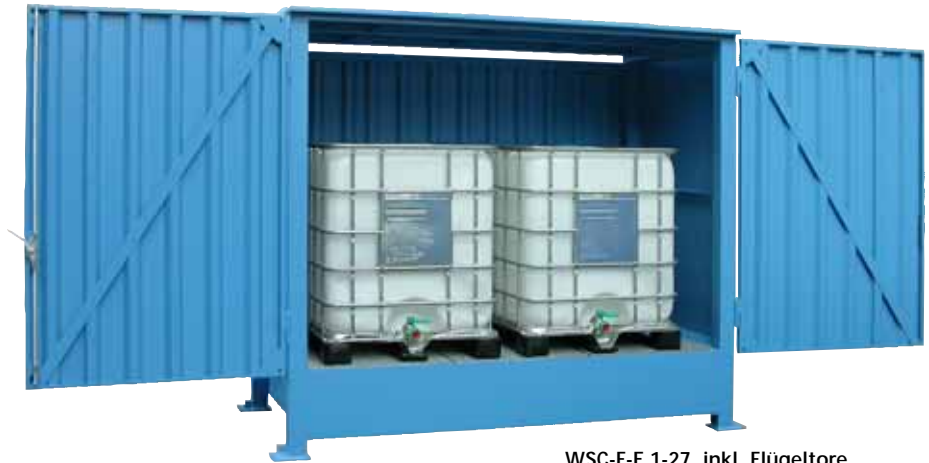
WSC-F-E.1-27, inkl. Flügeltore und natürlicher Belüftung, Artikel-Nr. C22-5236-C