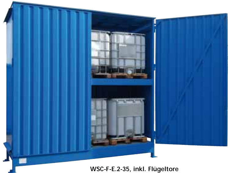
WSC-F-E.2-35, inkl. Flügeltore und natürlicher Belüftung, Artikel-Nr. C22-5218-C