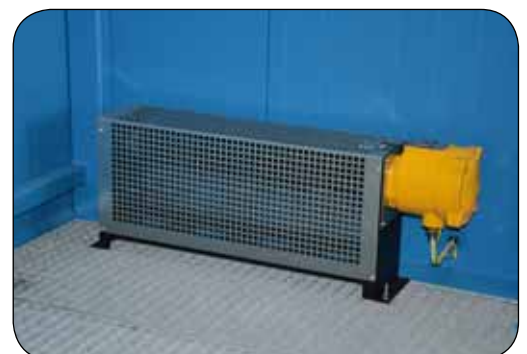
Ex-geschützte Heizung 1,5 kW