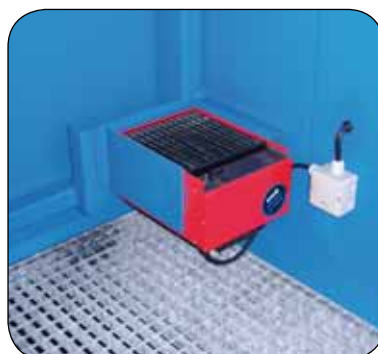
Umluftheizung nicht Ex-geschützt