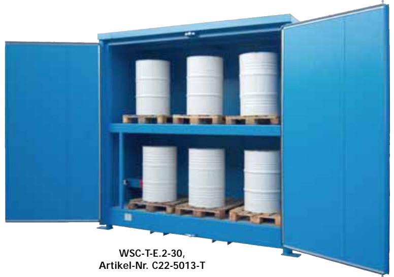
WSC-T-E.2-30, Artikel-Nr. C22-5013-T