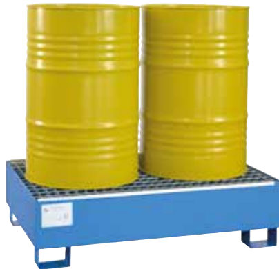
CW 2, painted, Article no. P65-2002-A