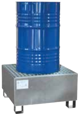
CW 1, fire-galvanized, Article no. P65-1001-A