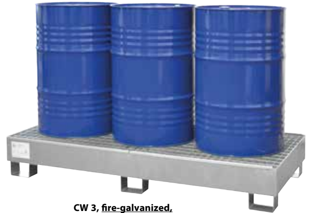
CW 3, fire-galvanized, Article no. P65-1007-A