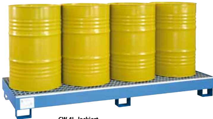
CW 4L, lackiert, Artikel-Nr. P65-2004-A

Wannen in Edelstahl finden Sie auf Seite 32!