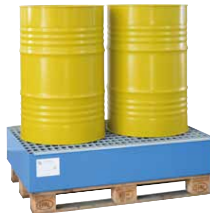
EW 2, painted, with grid, Article no. P66-2303-A