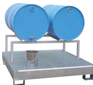
FB 2, Article no. P21-1702-A, on optional base sump tray CW 4