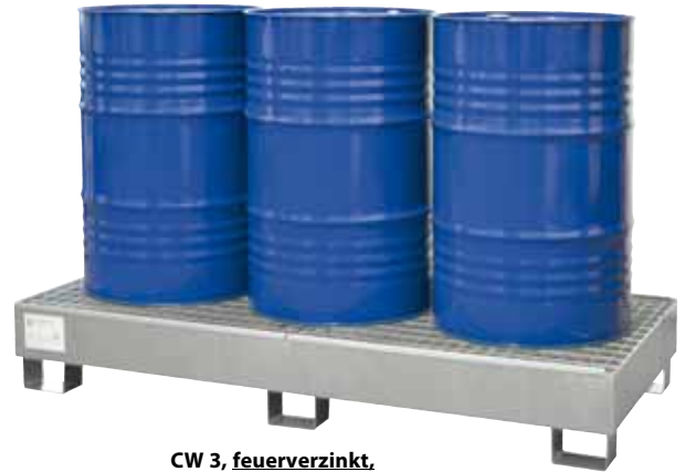
CW 3, feuerverzinkt, Artikel-Nr. P65-1007-A