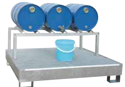
FB 3, Artikel-Nr. P21-1703-A, auf optionaler Auffangwanne CW 4