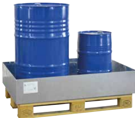
EW 2, fire-galvanized, without grid, Article no. P66-1301-A

* maximum capacity when used with galvanized grid