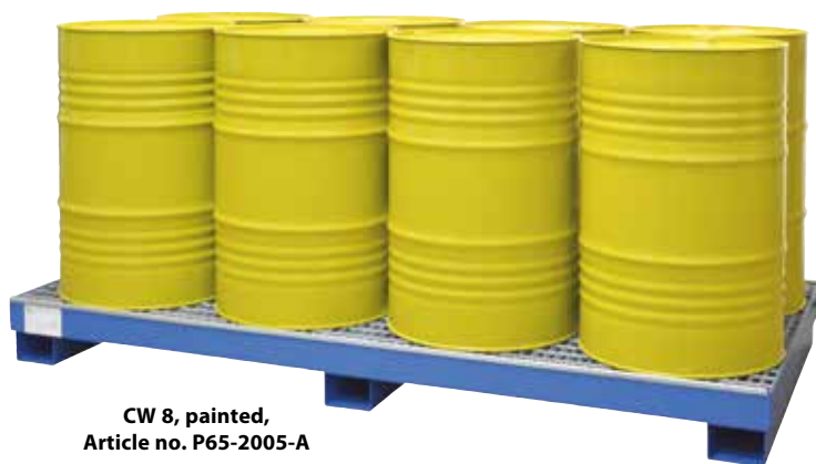
CW 8, painted, Article no. P65-2005-A