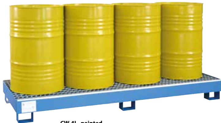
CW 4L, painted, Article no. P65-2004-A

Stainless steel sump pallets can be found on page 30!