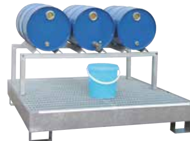
FB 3, Article no. P21-1703-A, on optional base sump tray CW 4