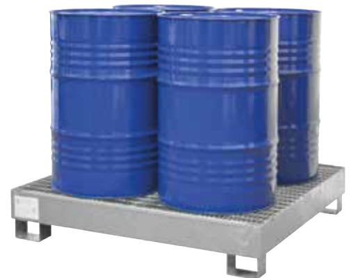
CW 4, fire-galvanized, Article no. P65-1003-A