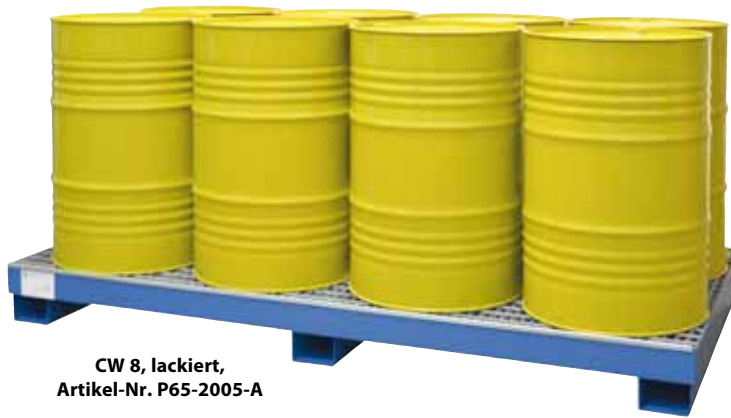
CW 8, lackiert, Artikel-Nr. P65-2005-A