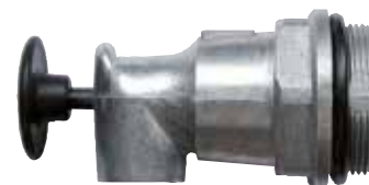
Article no. B69-2101-A