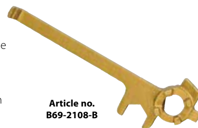
Article no. B69-2108-B