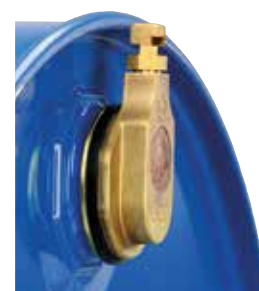
Article no. B69-2110-B