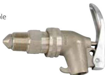
Article no. B69-2106-B