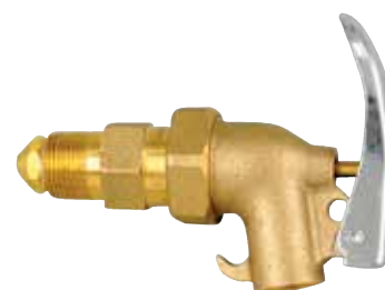
Article no. B69-2105-B