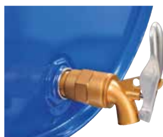
Article no. B69-2102-B