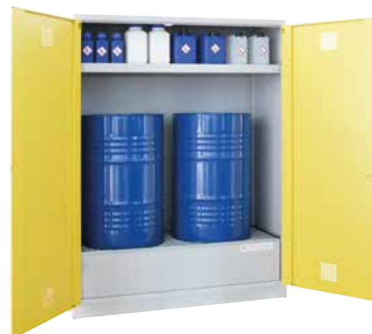
UWS-2FASS 200 P, Article no. B80-6246-A, with optional tray-shaped shelf