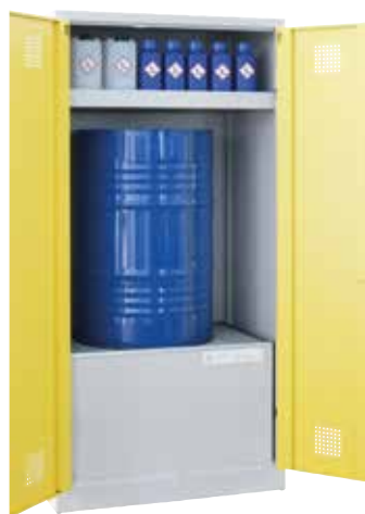
UWS-1FASS 200 P, Article no. B80-6245-A, with optional tray-shaped shelf