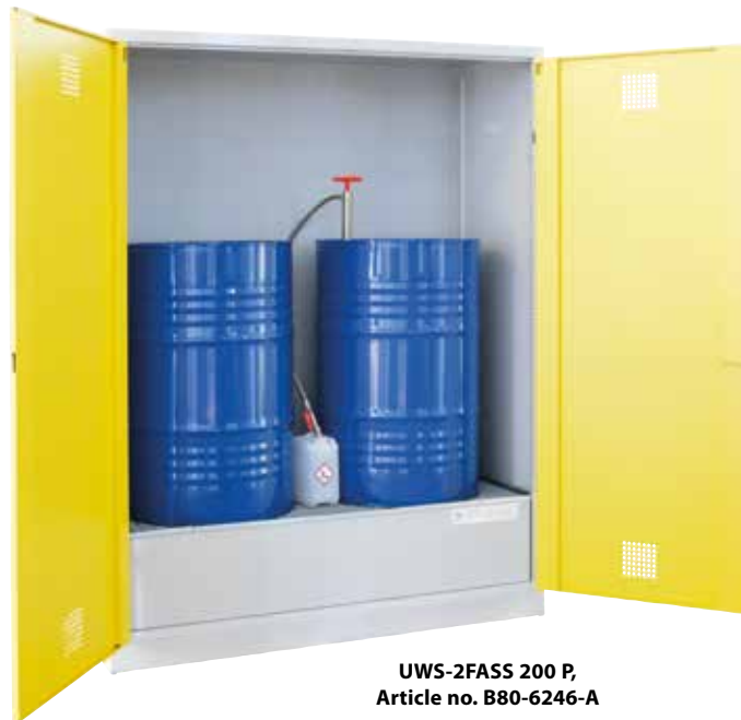
UWS-2FASS 200 P, Article no. B80-6246-A