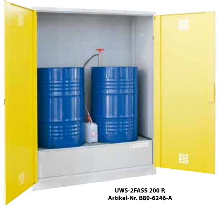
UWS-2FASS 200 P, Artikel-Nr. B80-6246-A