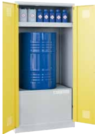
UWS-1FASS 200 P, Artikel-Nr. B80-6245-A, mit optionaler Einlegewanne