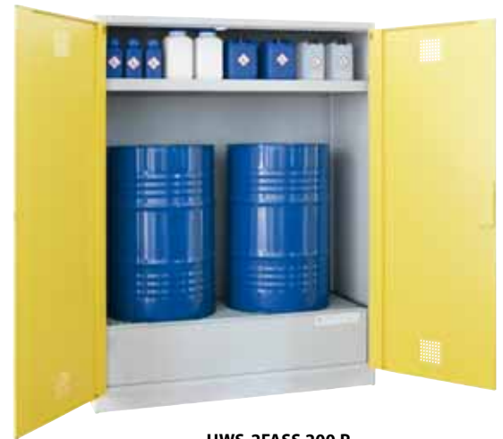
UWS-2FASS 200 P, Artikel-Nr. B80-6246-A, mit optionaler Einlegewanne