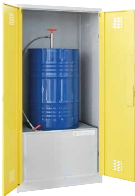
UWS-1FASS 200 P, Article no. B80-6245-A