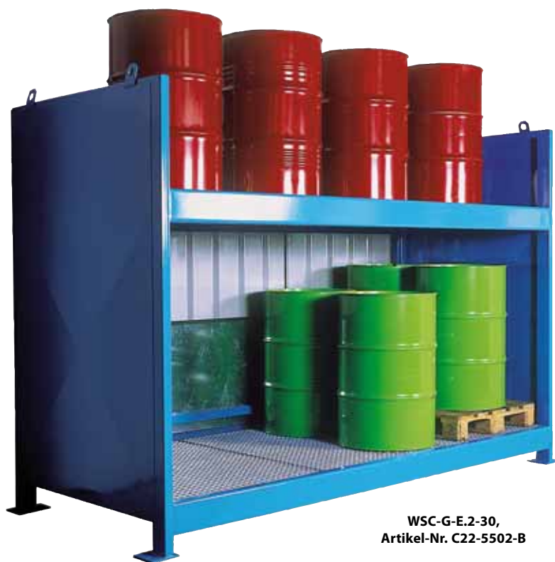
WSC-G-E.2-30, Artikel-Nr. C22-5502-B