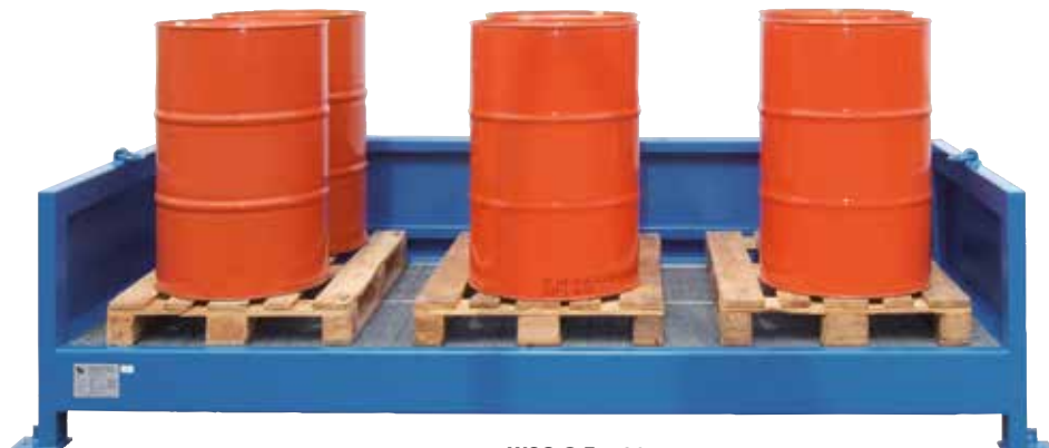
WSC-G-E.1-30, Article no. C22-5501-B