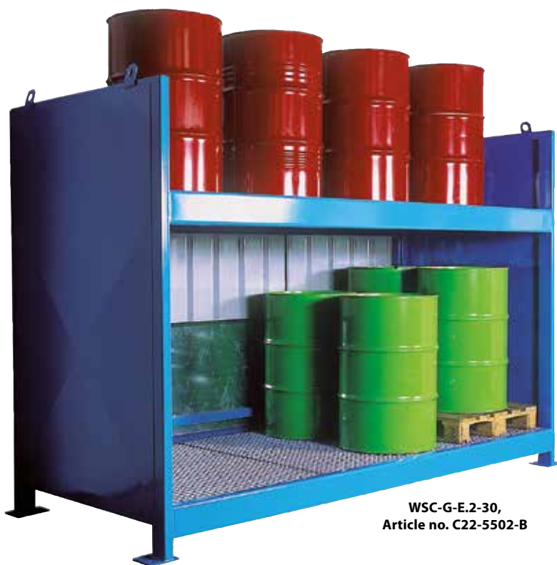
WSC-G-E.2-30, Article no. C22-5502-B