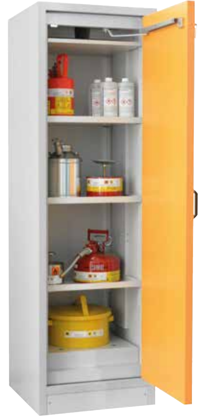
SiS Type 30 / 600, Article no. B80-2603-A, door RAL 1007 - daffodil yellow, incl. 3 shelves, base sump tray and perforated cover plate