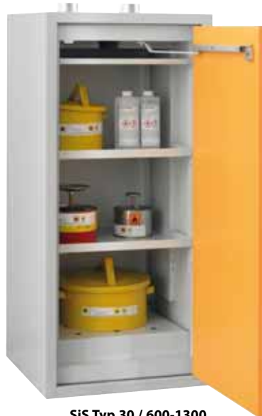
SiS Typ 30 / 600-1300, Artikel-Nr. B80-2608-A, Tür RAL 1007 - narzissengelb, inkl. 2 Einlegeböden, Bodenwanne und Lochblechabdeckung