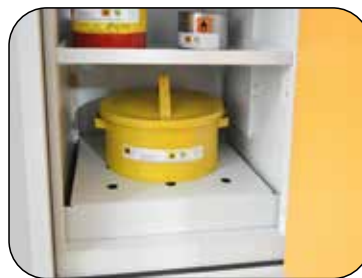
Base sump tray with perforated cover plate