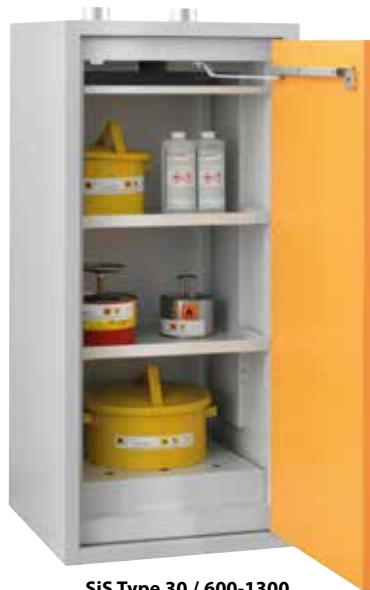
SiS Type 30 / 600-1300, Article no. B80-2608-A, door RAL 1007 - daffodil yellow, incl. 2 shelves, base sump tray and perforated cover plate