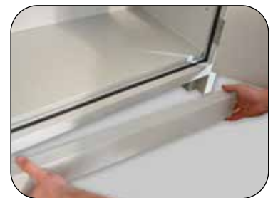
Socle included, with removable panel