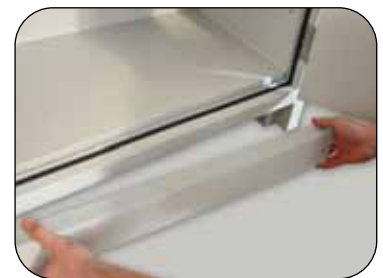
Inkl. Sockel, mit abnehmbarer Blende