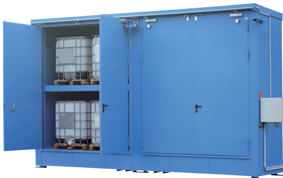
WSC-T-E.2-54 DF/F90, Artikel-Nr. C64-3004-A

Zur Realisierung der optimalen Lagerbedingung steht ein umfangreiches Zubehör zur Auswahl, wie technische Belüftung, Beleuchtung, Heizung, Kühlung, Türfeststellanlage, Brandmeldung!