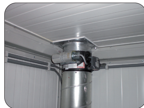
Abluftkanal mit K-90 Absperrvorrichtung