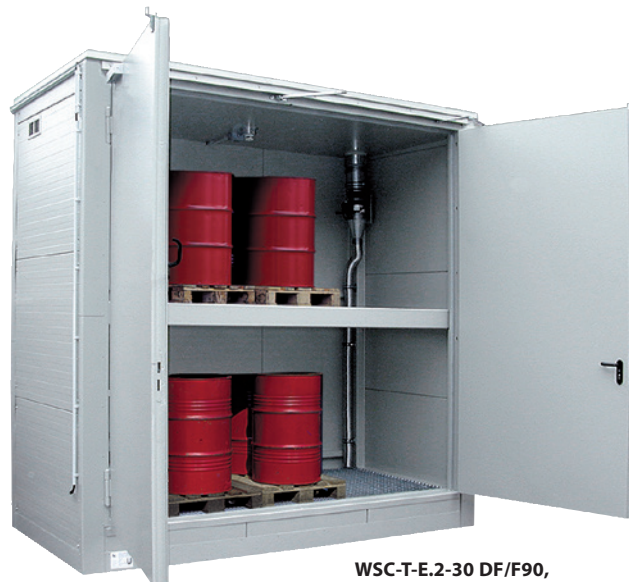
WSC-T-E.2-30 DF/F90, Artikel-Nr. C64-3001-A in Sonderfarbe