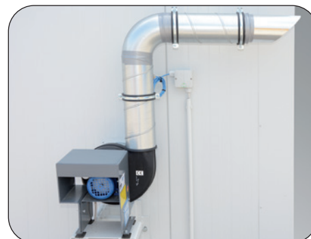
Ex-geschützter Abluftventilator inkl. Abluftüberwachung