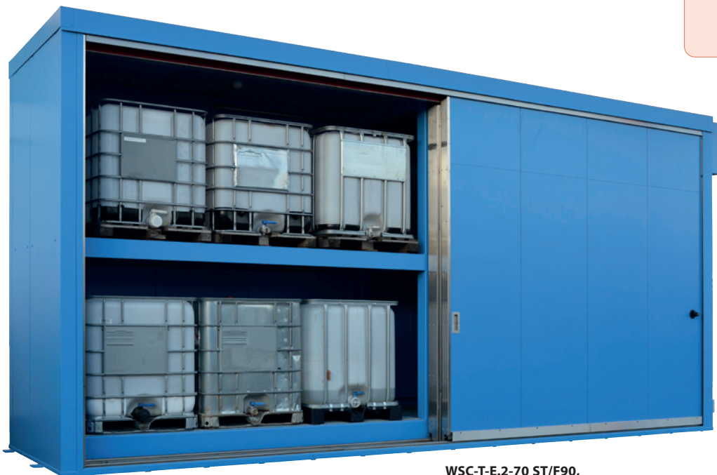
WSC-T-E.2-70 ST/F90, Artikel-Nr. C64-3012-A