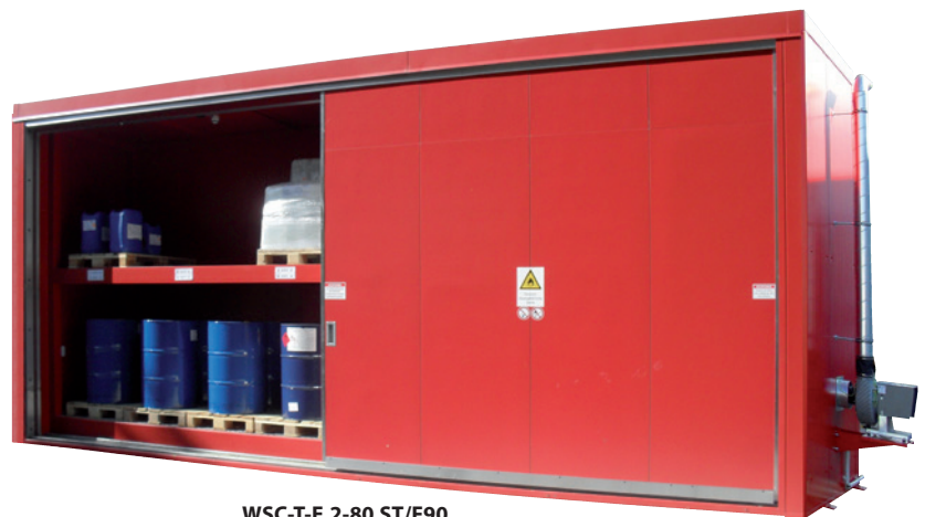
WSC-T-E.2-80 ST/F90, Artikel-Nr. C64-3013-A, in Sonderfarbe

Zur Realisierung der optimalen Lagerbedingung steht ein umfangreiches Zubehör zur Auswahl, wie technische Belüftung, Beleuchtung, Heizung, Kühlung, Brandmeldung!