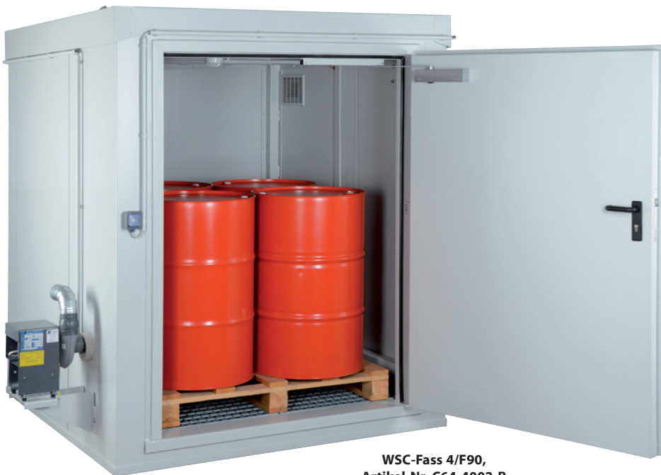
WSC-Fass 4/F90, Artikel-Nr. C64-4002-B