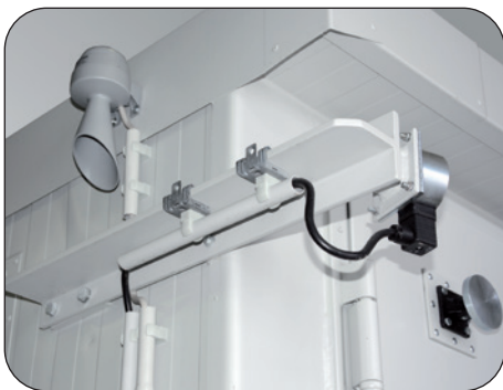
- Ex-geschützte Abluftüberwachung mit Signalhupe - Türhalteanlage