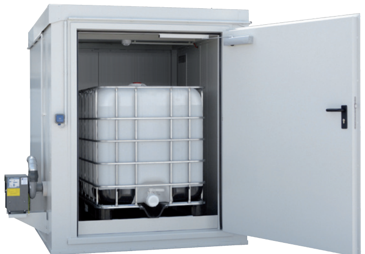
WSC-KTC 1/F90, Artikel-Nr. C64-4003-B