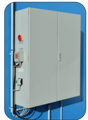
Schaltschrank mit zentraler Steuerung und Bedienelementen