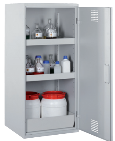
CHS 600-1300, Artikel-Nr. B80-6133-A