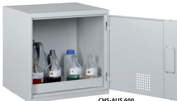
CHS-AUS 600, Article no. B80-6223-A