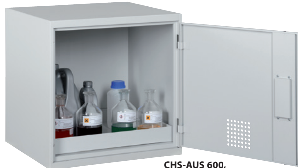
CHS-AUS 600, Artikel-Nr. B80-6223-A