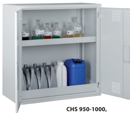
CHS 950-1000, Article no. B80-6122-A