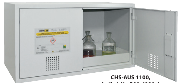
CHS-AUS 1100, Artikel-Nr. B80-6220-A