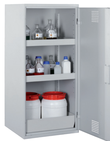
CHS 600-1300, Article no. B80-6133-A