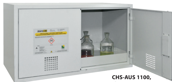
CHS-AUS 1100, Article no. B80-6220-A