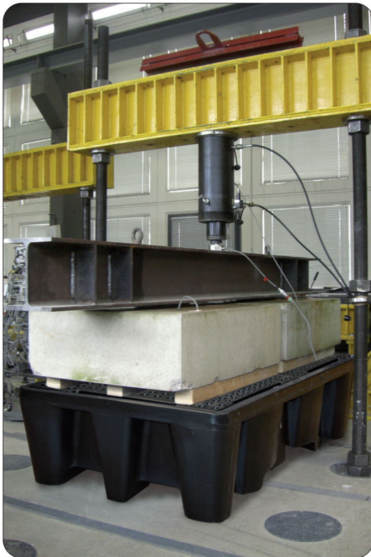
PE-KT-2 under a test load of 16.000 kg