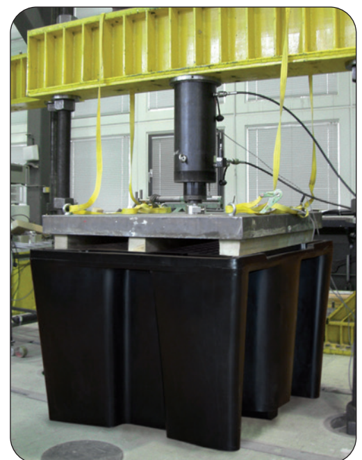
PE-KT-1 under a test load of 8.000 kg

Deformation tests and, above all, load tests were carried out on sumps filled with water. The load tests have successfully been conducted with a load 4-fold compared to the normal operating load.