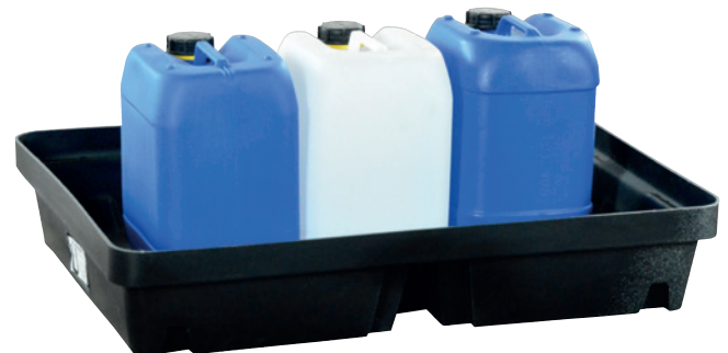
PE-40, without PE perforated plate, Article no. P70-2006-A