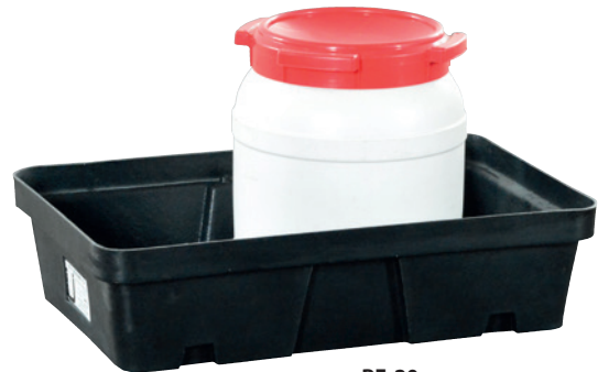
PE-20, without PE perforated plate, Article no. P70-2002-A