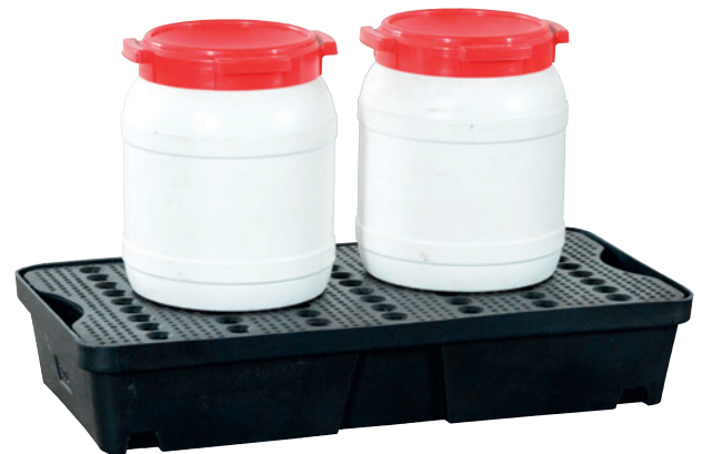
PE-30, with PE perforated plate, Article no. P70-2003-A