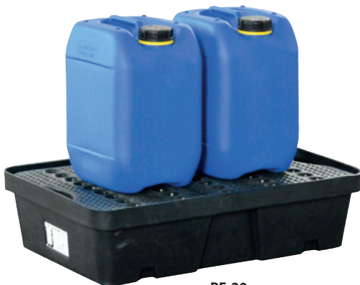
PE-20, with PE perforated plate, Article no. P70-2001-A