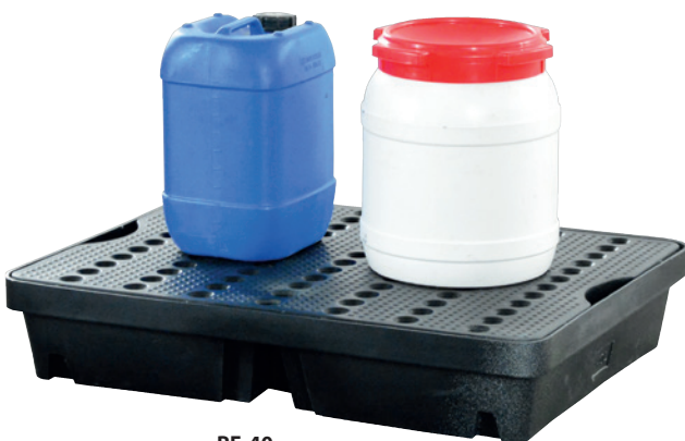
PE-40, with PE perforated plate, Article no. P70-2005-A