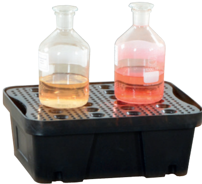
PE-10, with PE perforated plate, Article no. P70-2011-A