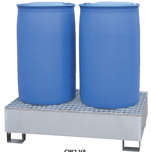
CW2-VA, Article no. P69-3001-A