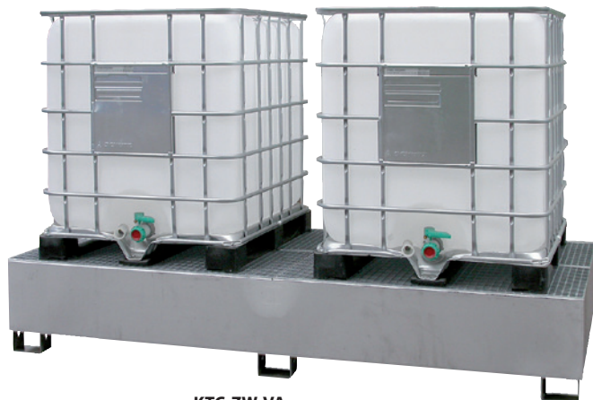
KTC-ZW-VA, Article no. P69-3004-A