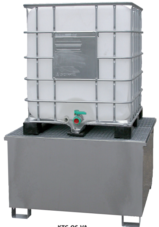
KTC-OS-VA, Article no. P69-3003-A

i Models KTC-OS and KTC-ZW are particularly suitable for storing KTCs / IBCs.