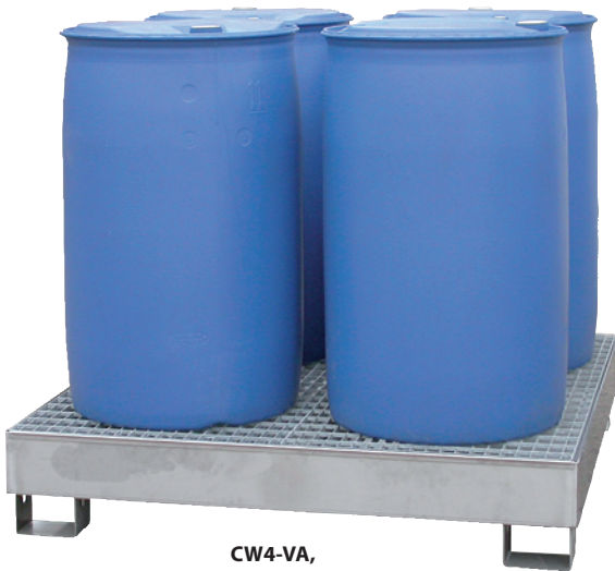
CW4-VA, Article no. P69-3002-A

i Models CW2 and CW4 are particularly suitable for storing 200 liter drums or small containers.