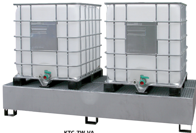
KTC-ZW-VA, Artikel-Nr. P69-3004-A