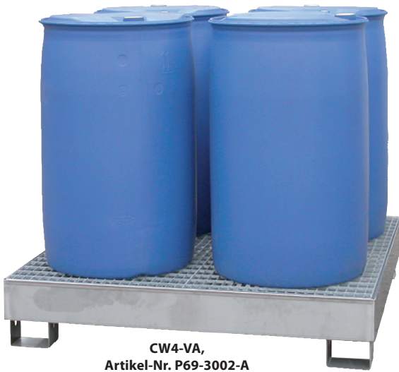
CW4-VA, Artikel-Nr. P69-3002-A

i Typenreihe CW2 u. CW4 sind speziell zur Lagerung von 200-Liter-Fässern oder Kleingebinden geeignet