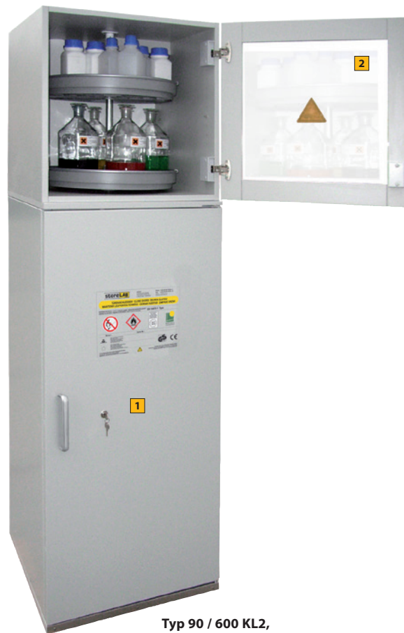
Typ 90 / 600 KL2, Artikel-Nr. B80-2889-A