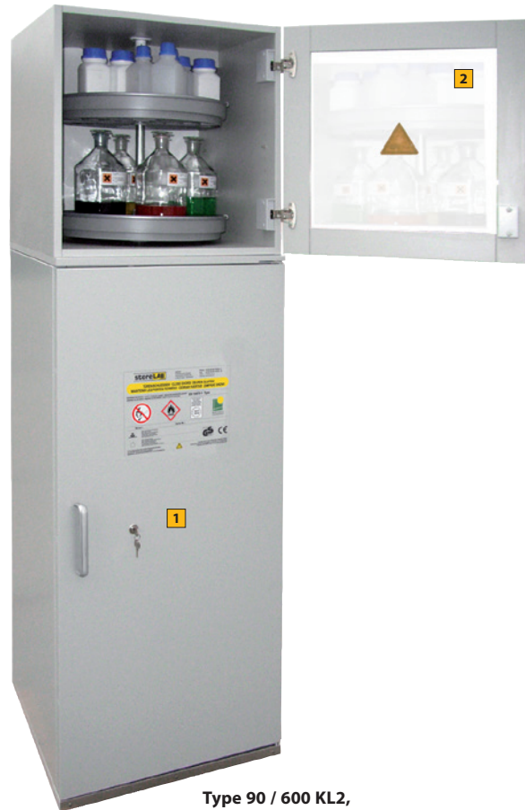
Type 90 / 600 KL2, Article no. B80-2889-A