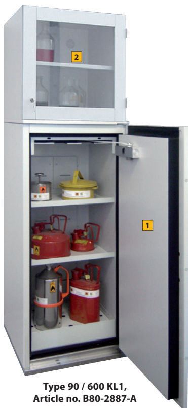
Type 90 / 600 KL1, Article no. B80-2887-A