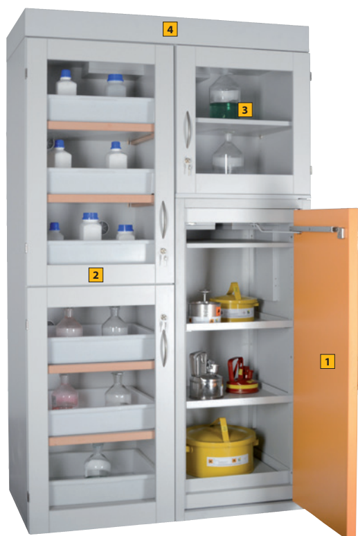
Type 30 / 1200 KL6 GL, Article no. B80-2617-A