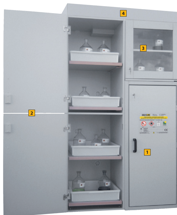
Type 30 / 1200 KL4, Article no. B80-2612-A