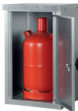
K-GFS 11, Artikel-Nr. C27-3213-B