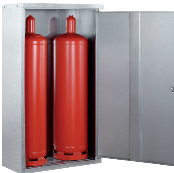
K-GFS 14, Article no. C27-3216-B