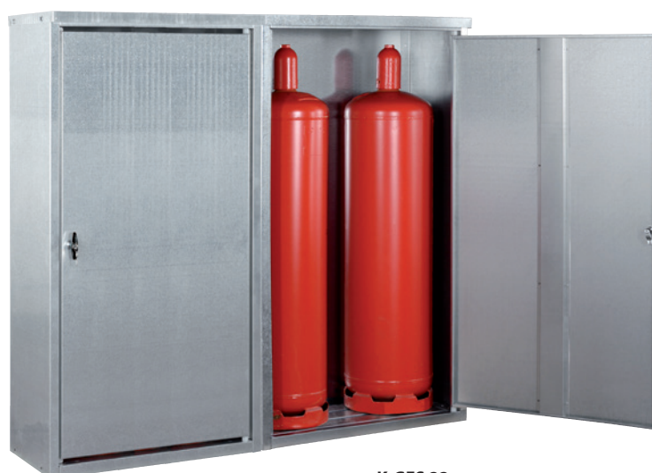
K-GFS 22, Article no. C27-3218-B