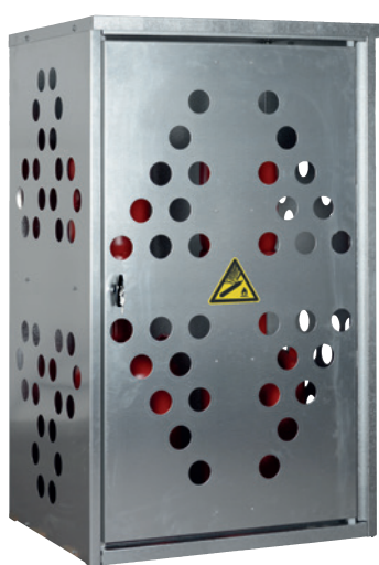
K-GFS 10, Article no. C27-3210-B