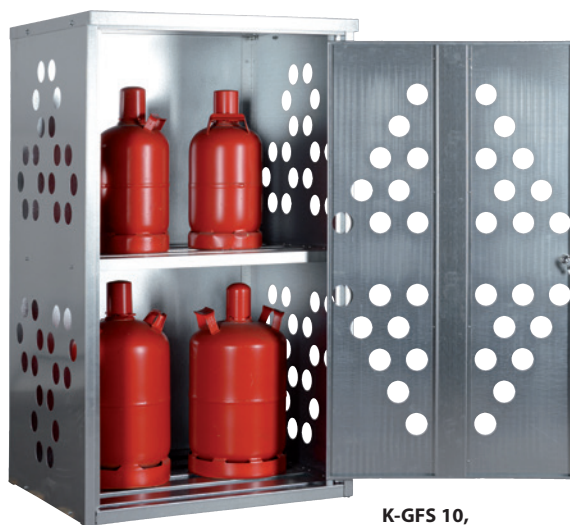
K-GFS 10, Article no. C27-3210-B