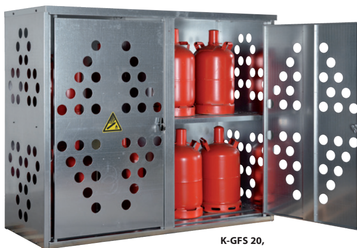
K-GFS 20, Article no. C27-3211-B