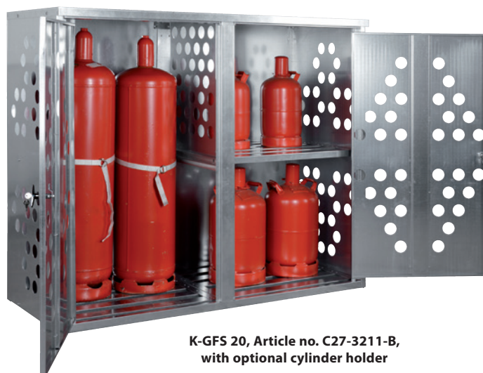
K-GFS 20, Article no. C27-3211-B, with optional cylinder holder