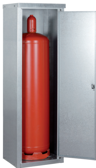
K-GFS 13, Artikel-Nr. C27-3215-B