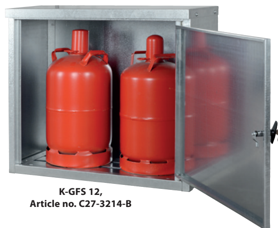
K-GFS 12, Article no. C27-3214-B