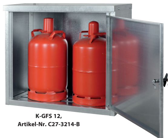
K-GFS 12, Artikel-Nr. C27-3214-B