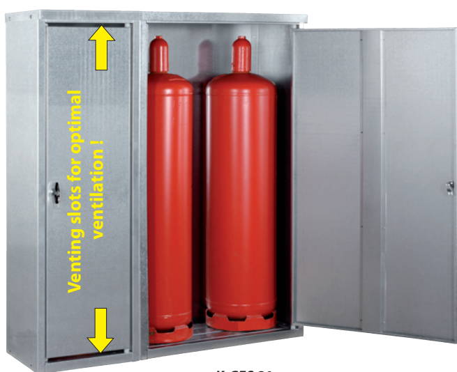
K-GFS 21, Article no. C27-3217-B