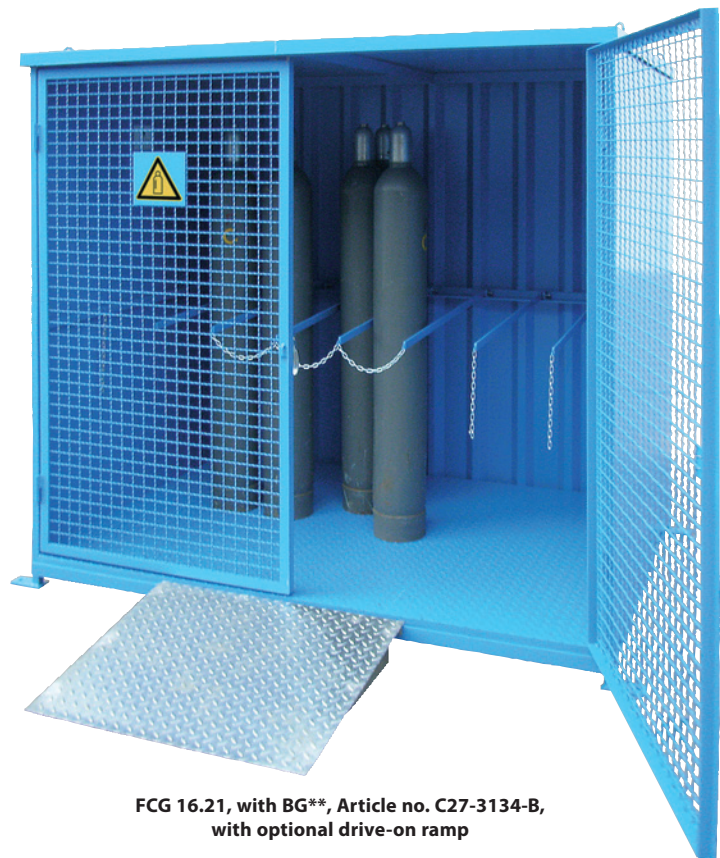
FCG 16.21, with BG**, Article no. C27-3134-B, with optional drive-on ramp