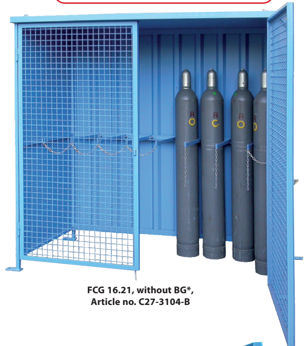
FCG 16.21, without BG*, Article no. C27-3104-B