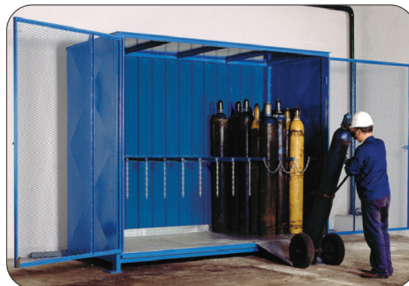
FCG-E.3.48, mit Bodengruppe, Artikel-Nr. C27-3110-B