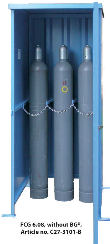
FCG 6.08, without BG*, Article no. C27-3101-B