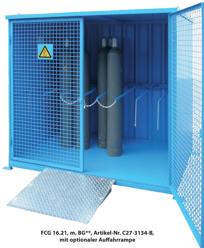
FCG 16.21, m. BG**, Artikel-Nr. C27-3134-B, mit optionaler Auffahrrampe