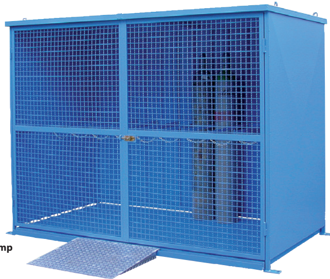
FCG 30.13, with base group, Article no. C27-3121-B, with optional drive-on ramp

Complies with TRGS 510 (Technical Rules for Pressurized Gases)