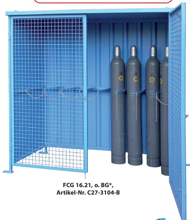
FCG 16.21, o. BG*, Artikel-Nr. C27-3104-B