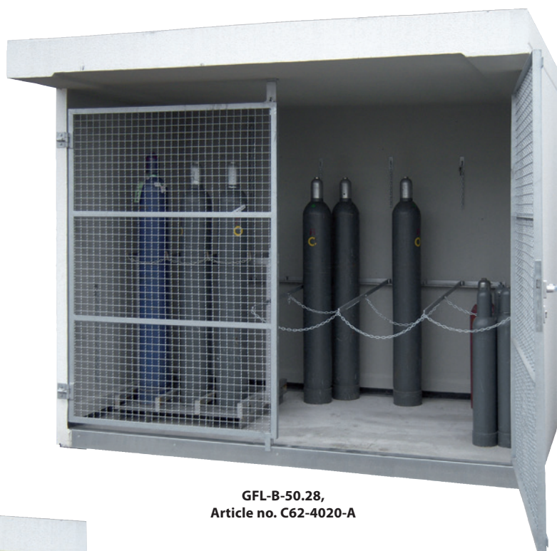
GFL-B-50.28, Article no. C62-4020-A

Flexible storing of single gas cylinders and/or gas cylinder pallets by movable cantilevers is possible.