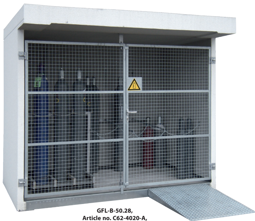
GFL-B-50.28, Article no. C62-4020-A, with optional drive-on ramp