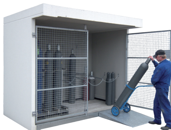
GFL-B-50.28, Article no. C62-4020-A, with optional drive-on ramp