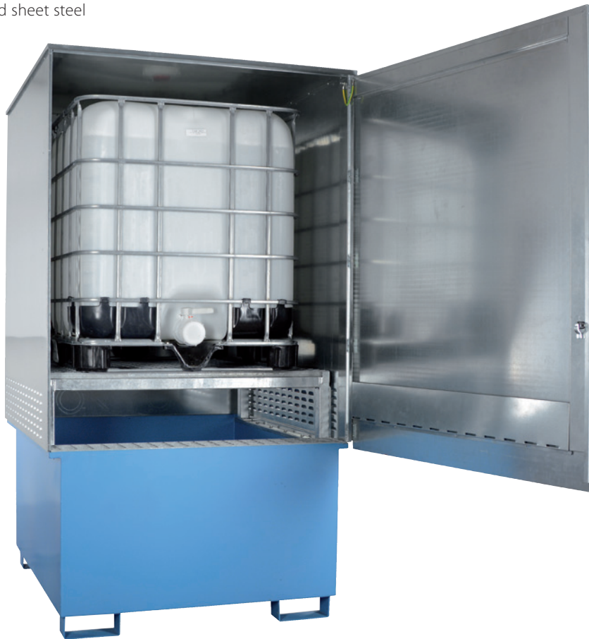
WSP-1SKKS-D/KTC, Article no. P21-2485-A