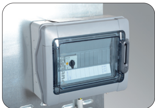
Switch box, incl. wiring