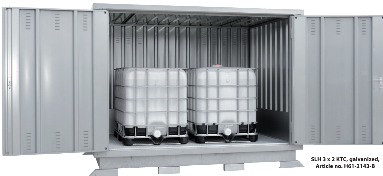
SLH 3 x 2 KTC, galvanized, Article no. H61-2143-B