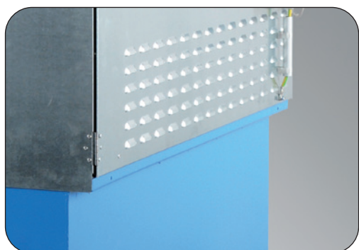
Ventilation slots in the side walls