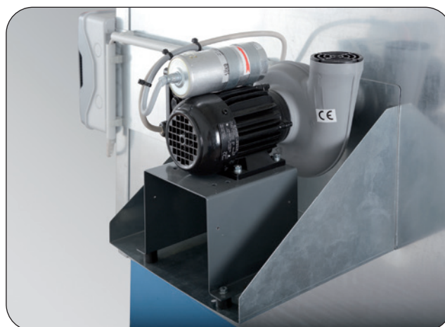
Exhaust fan set, Article no. P21-2486-A