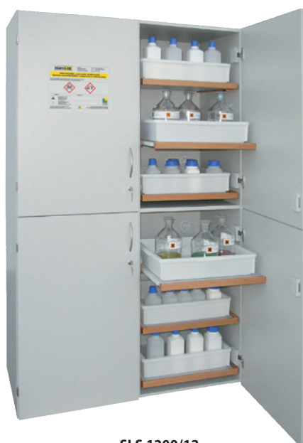
SLS 1200/12, Article no. B80-3016-D