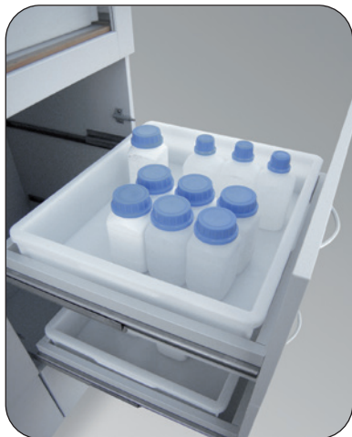
Vollauszugsschubfach mit Endanschlag