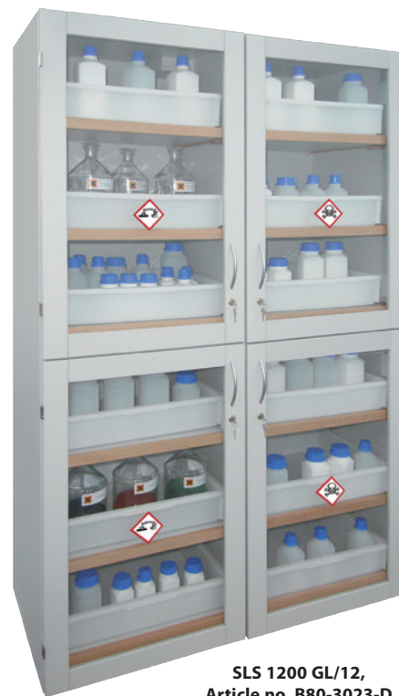
SLS 1200 GL/12, Article no. B80-3023-D