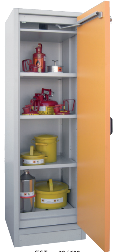
SiS Type 30 / 600, Article no. B80-2603-A, door RAL 1007 - daffodil yellow, incl. 3 shelves, base sump tray and perforated cover plate