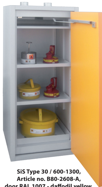
SiS Type 30 / 600-1300, Article no. B80-2608-A, door RAL 1007 - daffodil yellow, incl. 2 shelves, base sump tray and perforated cover plate