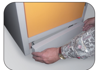
Socle included, with removable panel