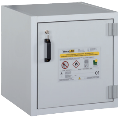
AUS Type 30 / 600 FT, door RAL 7035, Article no. B80-2639-A