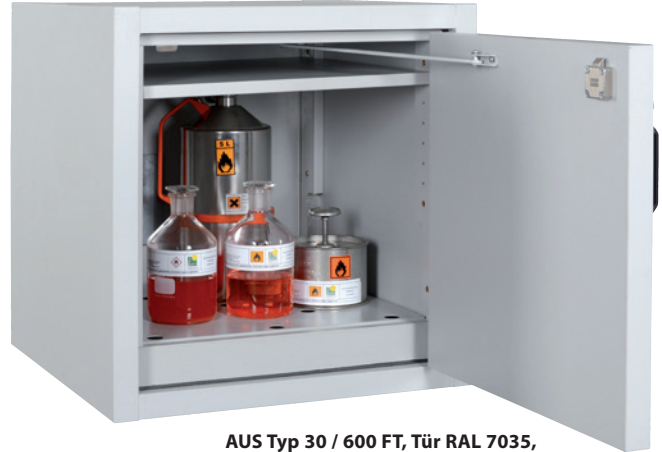
AUS Typ 30 / 600 FT, Tür RAL 7035, Artikel-Nr. B80-2639-A