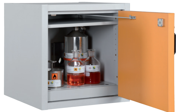
AUS Type 30 / 600 FT, door RAL 1007, Article no. B80-2640-A