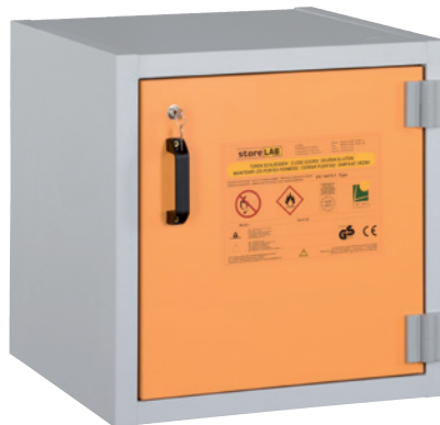
AUS Type 30 / 600 FT, door RAL 1007, Article no. B80-2640-A