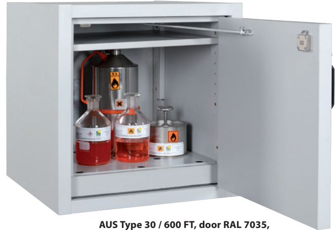
AUS Type 30 / 600 FT, door RAL 7035, Article no. B80-2639-A