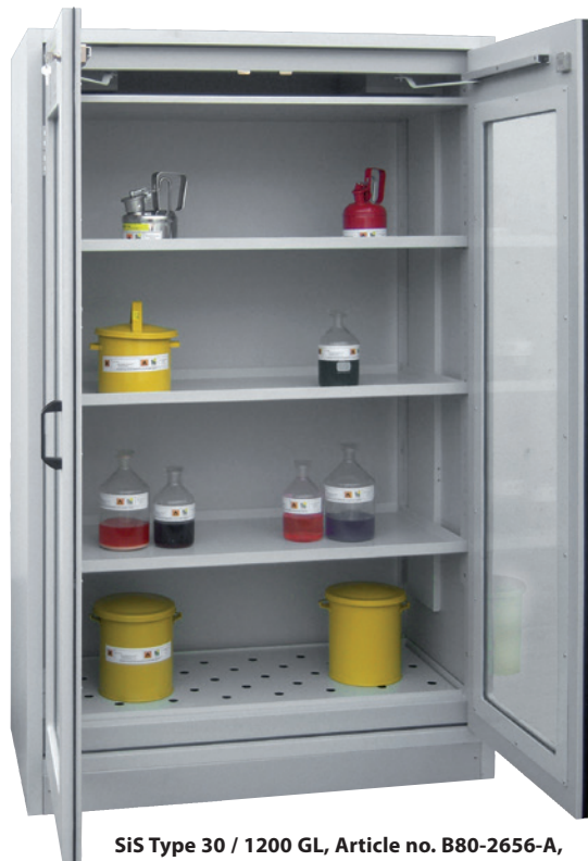
SiS Type 30 / 1200 GL, Article no. B80-2656-A, doors RAL 7035 - light grey, incl. 3 shelves, base sump tray and perforated cover plate