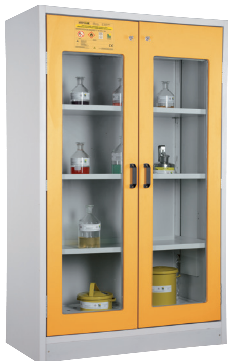
SiS Type 30 / 1200 GL, Article no. B80-2657-A, doors RAL 1007 - daffodil yellow, incl. 3 shelves, base sump tray and perforated cover plate