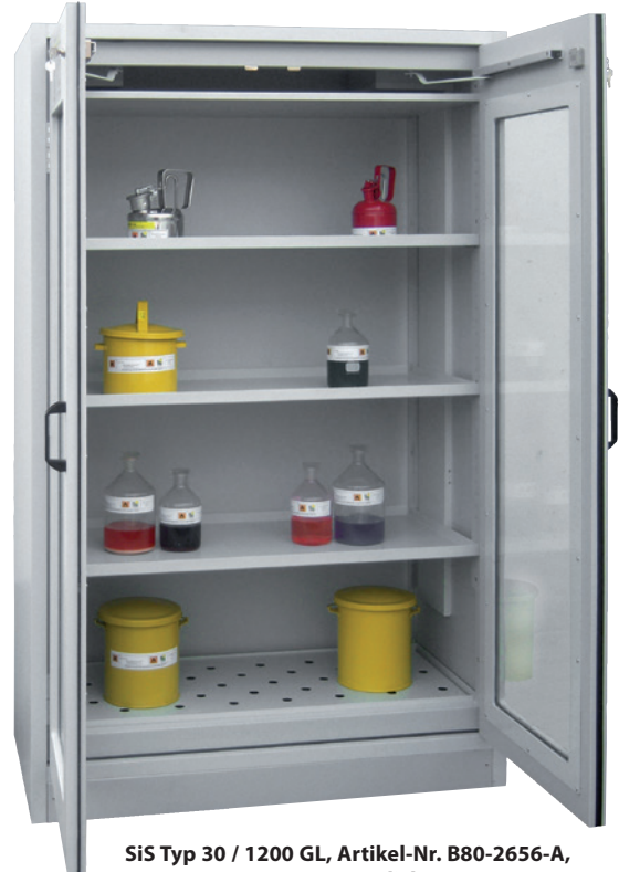
Sis Typ 30 / 1200 GL, Artikel-Nr. B80-2656-A, Türen RAL 7035 - lichtgrau, inkl. 3 Einlegeböden, Bodenwanne und Lochblechabdeckung