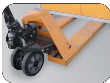
Socle included, with removable panel