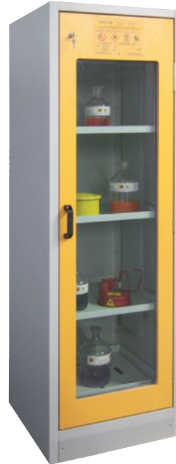
SiS Type 30 / 600 GL, Article no. B80-2655-A, door RAL 1007 - daffodil yellow, incl. 3 shelves, base sump tray and perforated cover plate