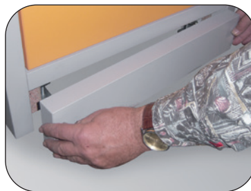
Socle included, with removable panel