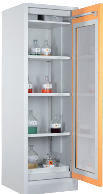
SiS Type 30 / 600 GL, Article no. B80-2655-A, door RAL 1007 - daffodil yellow, incl. 3 shelves, base sump tray and perforated cover plate