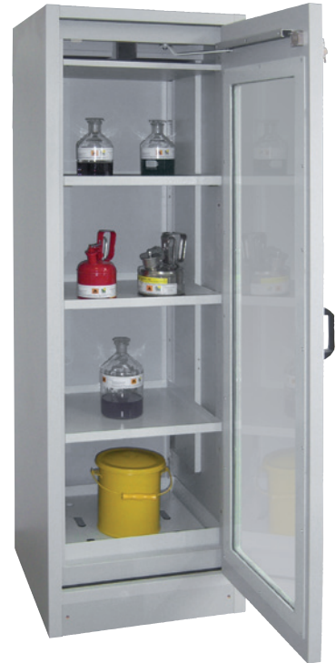
SiS Type 30 / 600 GL, Article no. B80-2654-A, door RAL 7035 - light grey, incl. 3 shelves, base sump tray and perforated cover plate